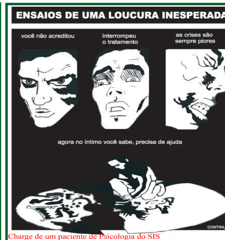
Charge de um paciente de Psicologia do SIS