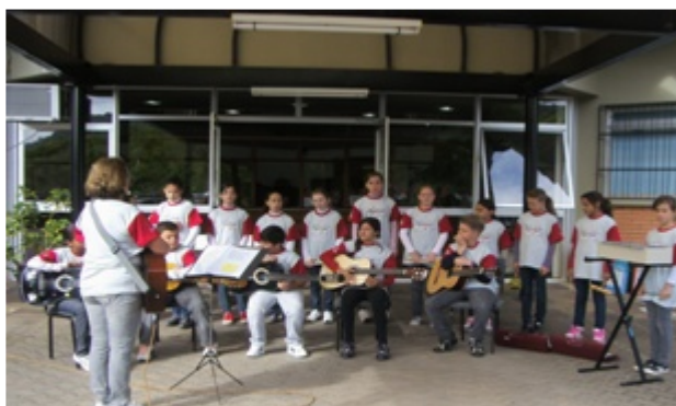
Abertura do Evento: Grupo Musicando - Projeto MOVIDA

Estagiárias do curso de Psicologia - SIS/UNISC