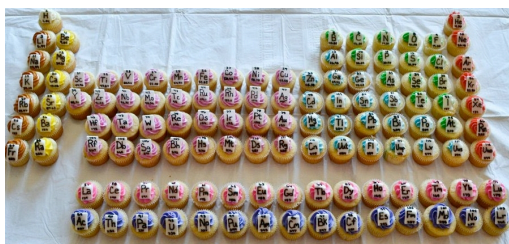
Figura 1: Tabela Periódica Comestível