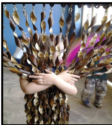
Figura 4: Brincando e movimentando as materialidades sonoras.