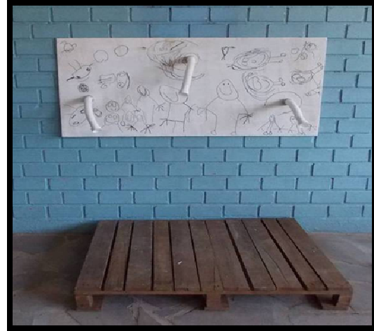
Figura 6: Painel com os canos fixados e um de suporte para provocar sons.