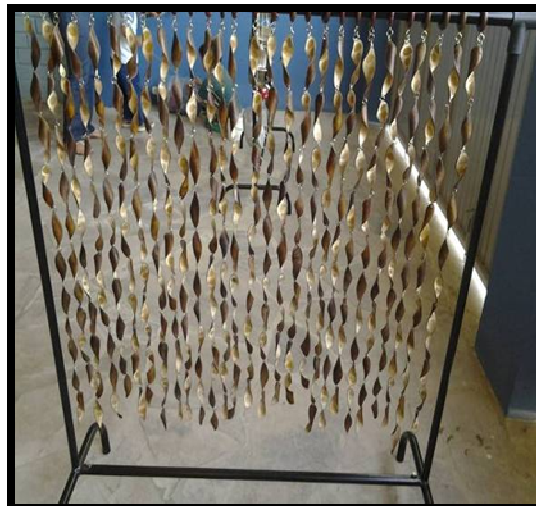
Figura 2: Cortina de sementes fixada em uma arara.