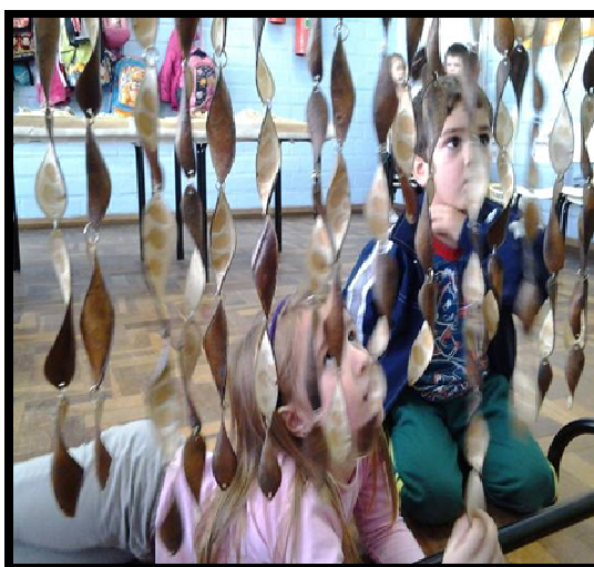
Figura 3: Escutando a cortina.