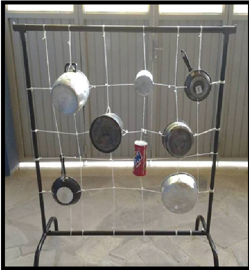
Figura 9: Diferentes Panelas e latas furadas e amarradas.