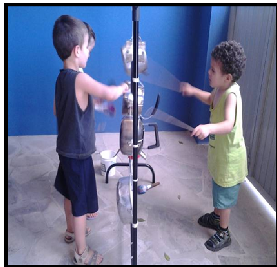
Figura 12: Quando barulhar é pura diversão.