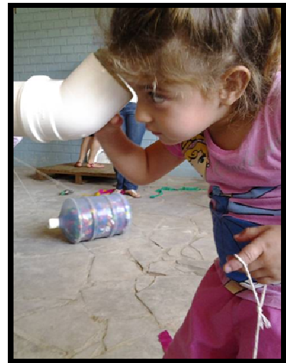
Figura 14: Espiando o som...