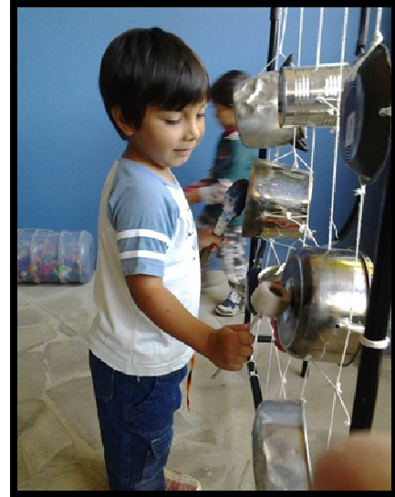
Figura 10: Experimentando o paneleiro.