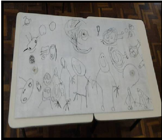
Figura 5: Painel de mdf com gesso ilustrado pelas paletes crianças.