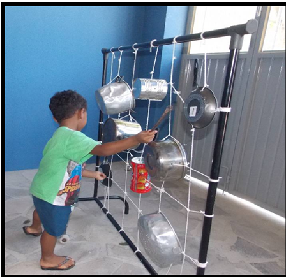
Figura 11: Esboços de Composição.