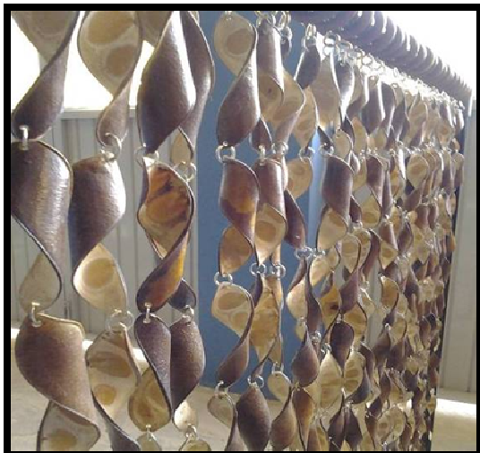
Figura 1: Cortina feita com cascas de Sementes. arara.