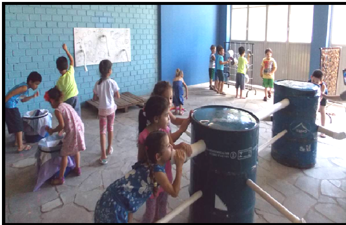
Figura 15: Gafanhotos na colheita é esse?