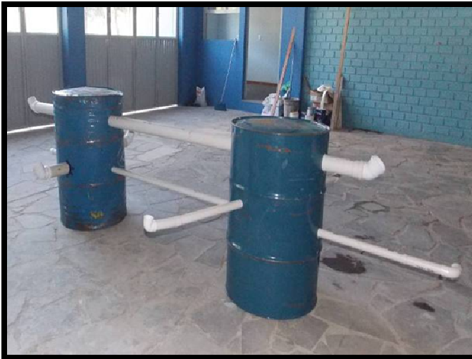
Figura 13: Construindo provocações para soar.