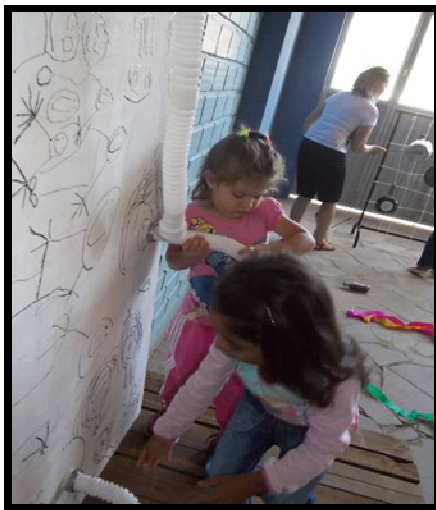
Figura 7: Canos para puxar e ouvir.