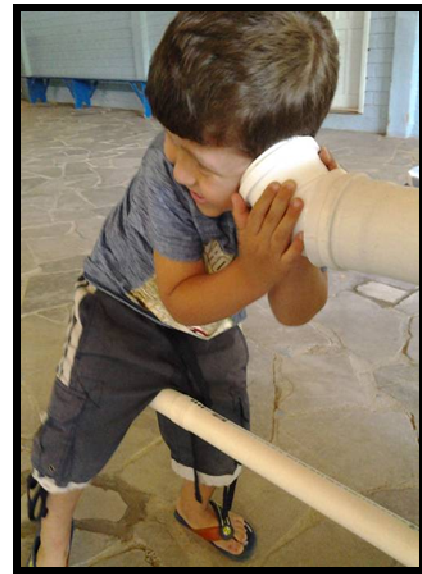
Figura 16: Escuta só, que som é esse?