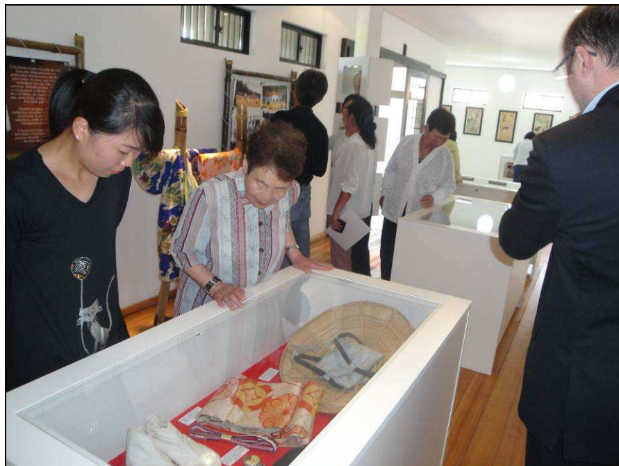
Figura 3 - Vitrine com aspectos da indumentária, acompanhada por manequins ao fundo. Foto feita por ocasião da primeira visita da comunidade ao museu.