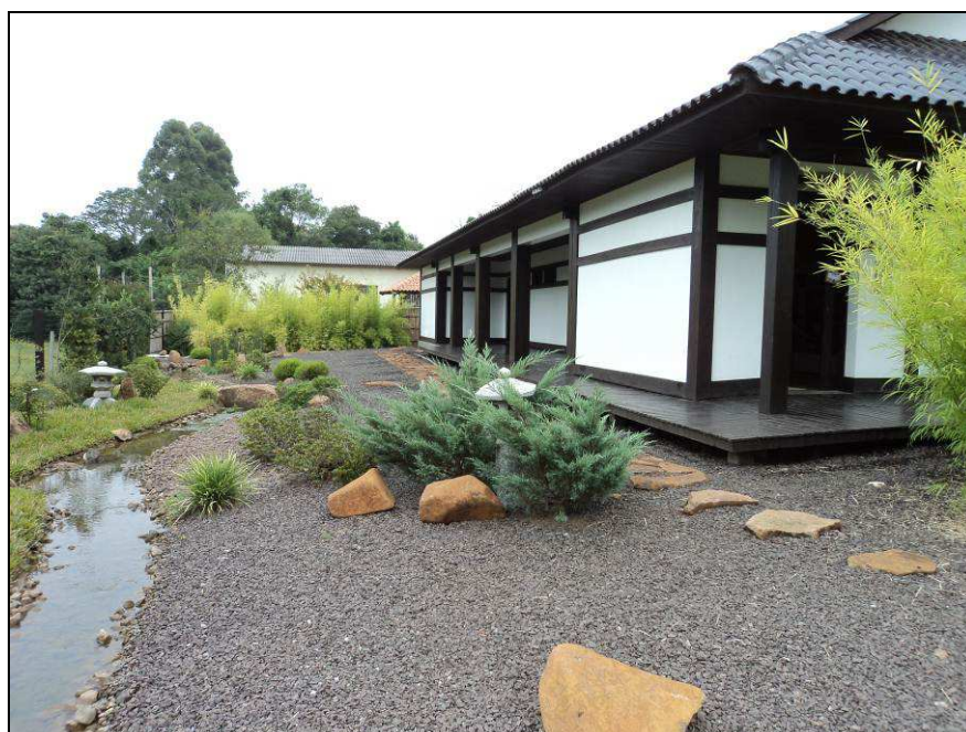
Figura 4 - Área externa do Memorial que complementa a museografia interna com jardim japonês para contemplação.