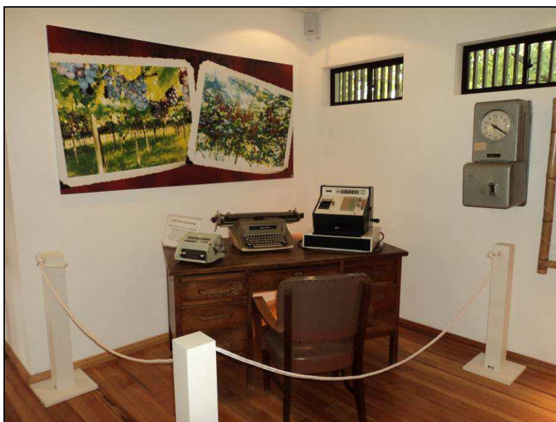
Figura 1 - Ambiente da Cooperativa Agrícola no Memorial da Colônia Japonesa de Ivoti - RS.

Nestes encontros a comunidade apontou quais eram os pontos que considerava mais importantes na sua trajetória e que acervo tinha para representar estes momentos mais emblemáticos. Entre outros aspectos, ficou estabelecido que o período de existência da Cooperativa Agrícola foi aquele em que os objetivos das famílias haviam se concretizado e, portanto, deveria ser destaque na exposição. A forma encontrada para dar a devida relevância a este ponto foi a implementação de uma única ambiência no Memorial, que representa a Cooperativa através de seu mobiliário, como podemos ver na imagem abaixo.