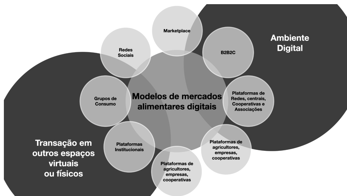
Figura 2 – Tipos de mercados alimentares digitais e suas interrelações com espaços físicos e digitais.