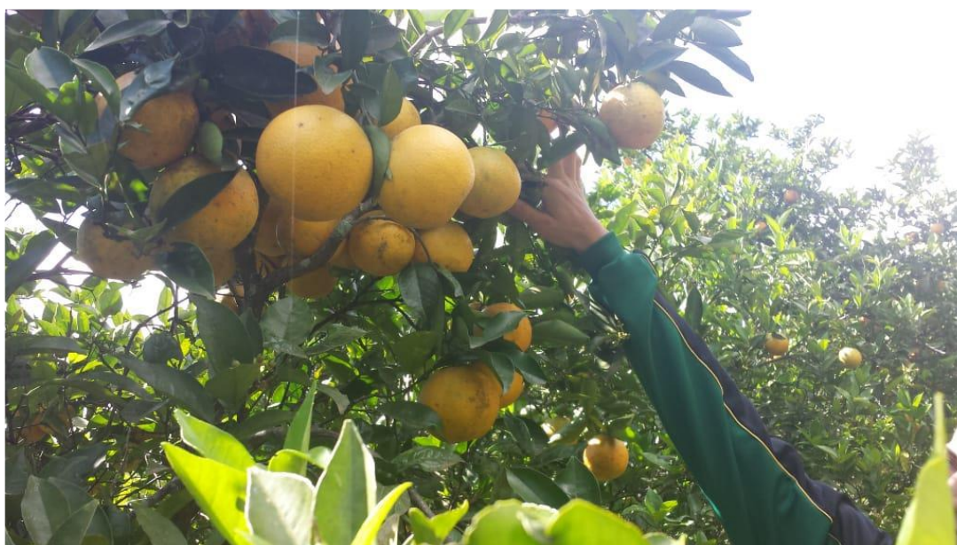
Figura 3 – Produção de laranja na propriedade

No pomar de citros se percebe um controle excelente de doenças e da mosca da fruta. As doenças são controladas pelo equilíbrio nutricional das plantas com o manejo do solo e limpeza das plantas, e ainda com a aplicação de biofertilizante e calda a base de enxofre. O controle da mosca da fruta é realizado com a utilização de iscas de solução proteica (melado, vinagre e água 2 colheres de sopa de melado, 1 litro de água, 1 colher de chá de vinagre - duração de 2 meses em média, na sombra) que atraem a mosca; os frascos dessas iscas são preparados a partir da reciclagem de garrafas pet. A calda sulfocálcica (enxofre) é um repelente da mosca, acredita Perci.