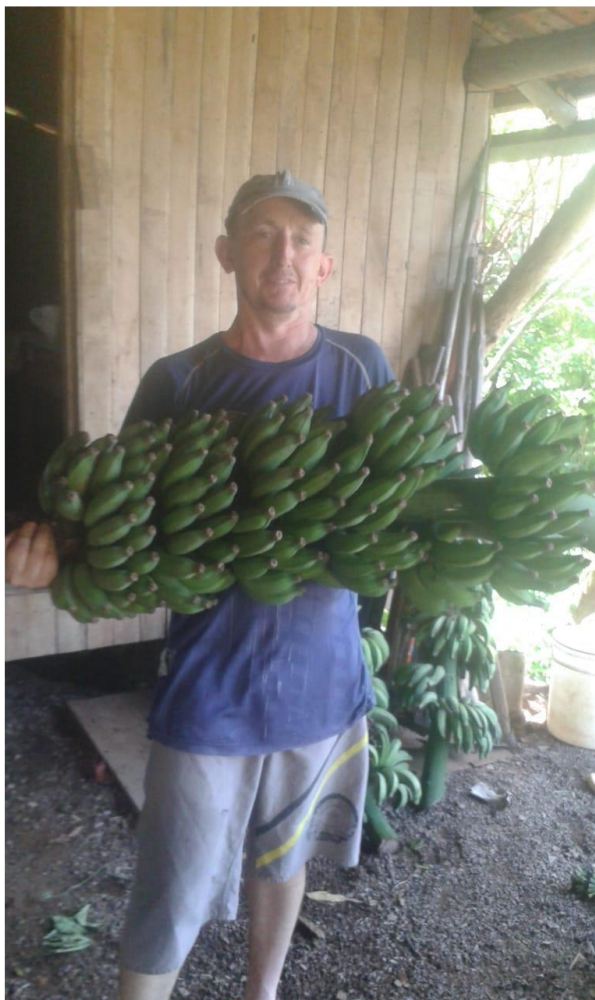
Figura 2 – Produção de banana na propriedade