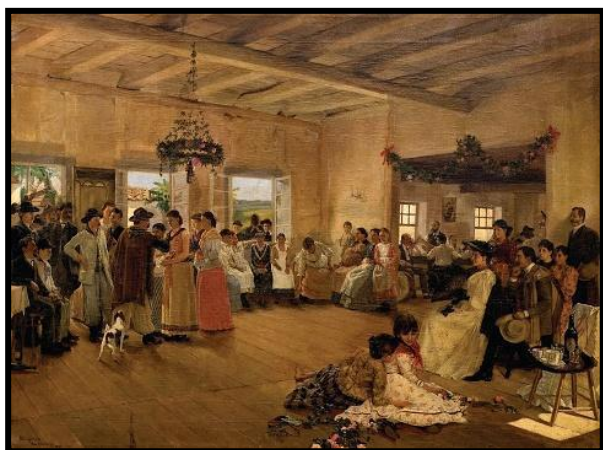
Figura 3: Kerb , 1892.