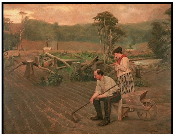
Figura 1: Tempora Mutantur , 1898.