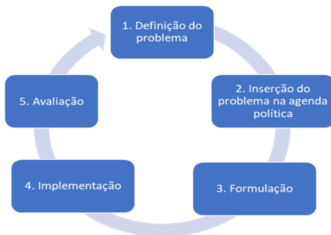
Figura 2: Ciclo das políticas públicas

A teoria dos ciclos elenca cinco fases que permitem entender como uma política surge e se desenvolve: (i) percepção e definição do problema; (ii) inserção na agenda política; (iii) formulação; (iv) implementação; e (v) avaliação. 8