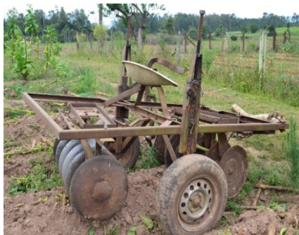
Imagem 3- Disco a Boi Adaptado com rodas e regulagem de profundidade

Pesquisadora: E com o disco o que mudou, depois que o senhor começou a usar o disco? P.S.: O disco ele era um disco antigo a boi né, ele era e daí não funcionava como era para ser e se eu precisava transportar, tinha que carregar numa carroça pra levar de uma lavoura para outra né, porque tem as estradas e já pensando nisso e não destruir, não demolir o camaleão né, aí fiz o disco com roda e regulagem de profundidade né.