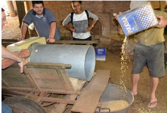
Imagem 2- Limpador de Feijão