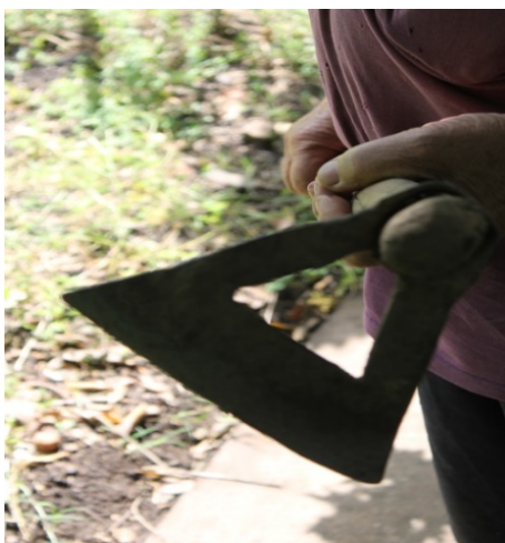
Imagem 1- Enxada Vazada

A enxada vazada (Imagem 1) que em um primeiro momento foi criada para facilitar o trabalho de sua esposa na lavoura, sendo que ela ao utilizar a enxada na capina gostou do resultado, despertando o interesse de outros agricultores da sua localidade. Essa criação deu tão certo que Armindo Kittel possui enxadas vazadas prontas para a comercialização em sua pequena propriedade.