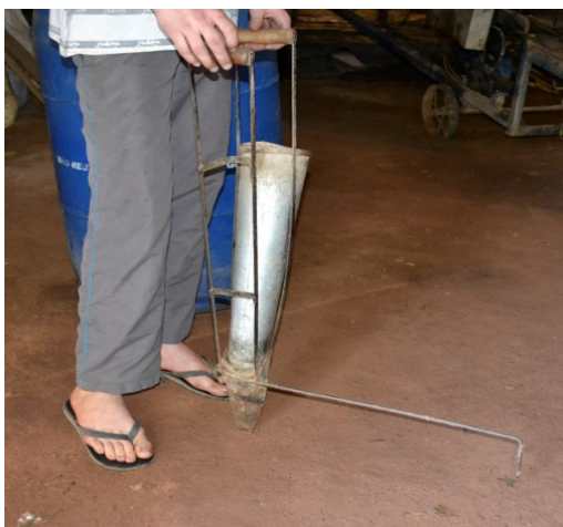
Imagem 4- Régua que marca a distância acoplada a Plantadeira de Fumo Adaptada

Depois de devidamente experimentada e aprovada, a régua que marca a distância acoplada a plantadeira de fumo (Imagem 4) pode ser utilizada normalmente. Foi constatada pelo agricultor a melhora na distância entre as plantas, que não ficaram com grandes diferenças umas das outras, sendo que a qualidade e o tamanho do fumo também melhoraram, pois essa distância padronizada possibilitou o desenvolvimento das mudas. No caso do bico da plantadeira a modificação possibilitou com que a planta ficasse mais firme dentro da máquina, fazendo com o torrão ao entrar em contato com o solo pegue mais rápido, não chegando nem a murchar, tornando-se cada vez menos necessário realizar o replante posteriormente. Alguns agricultores da localidade também realizam essa modificação, melhorando o desenvolvimento desta atividade produtiva. (ETAPA 5).