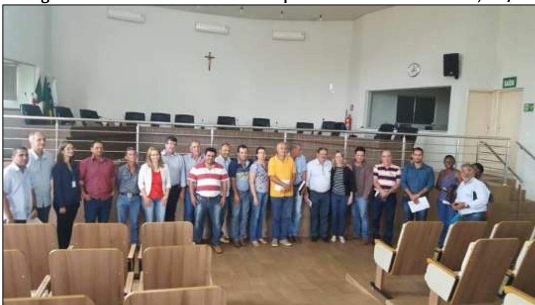
Figura 2. Plenária Realizada no Município de Santa Helena de Goiás, 2017