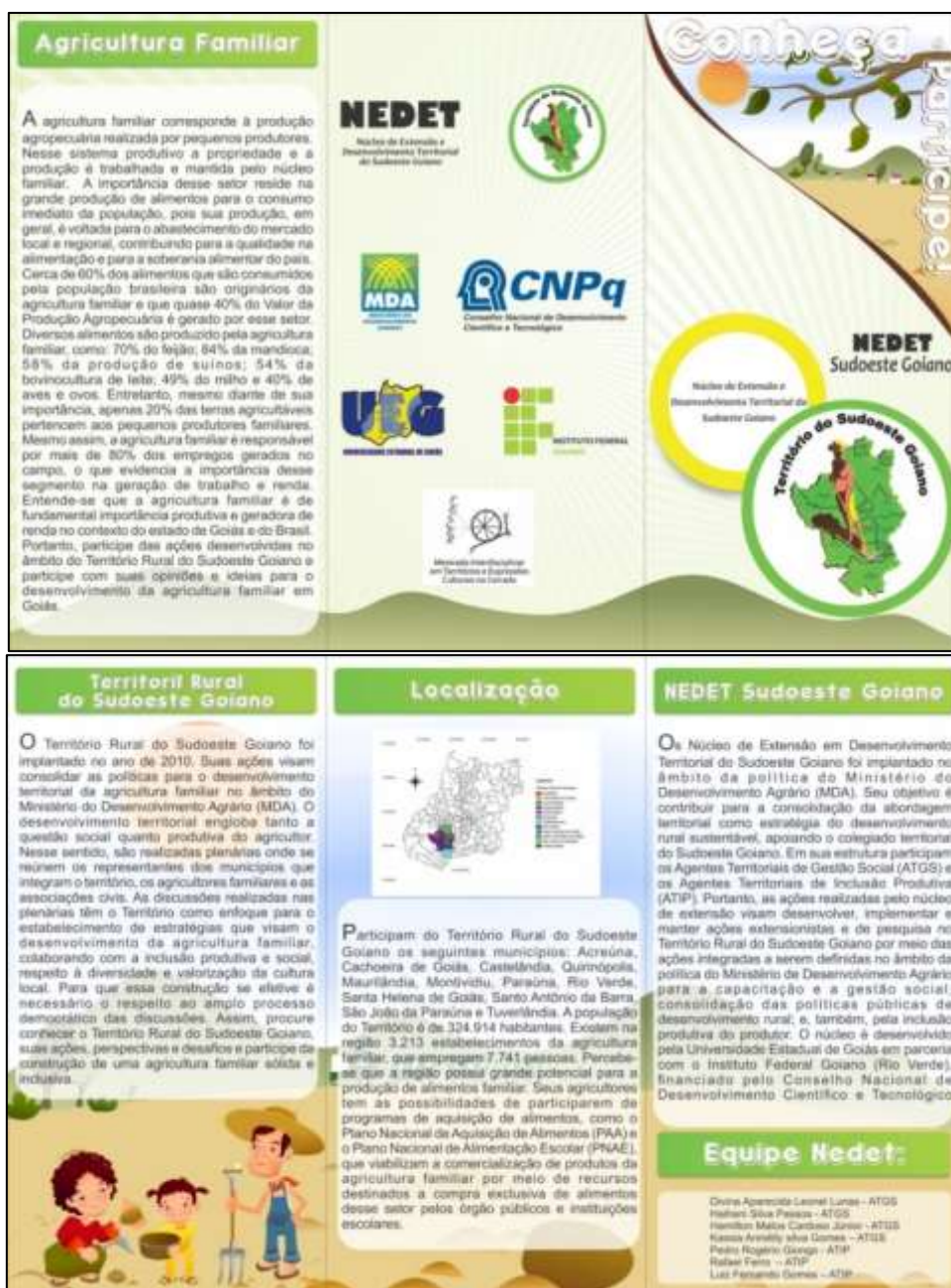
Figura 3. Folder de divulgação da política do desenvolvimento territorial no Sudoeste Goiano – Goiás, 2015