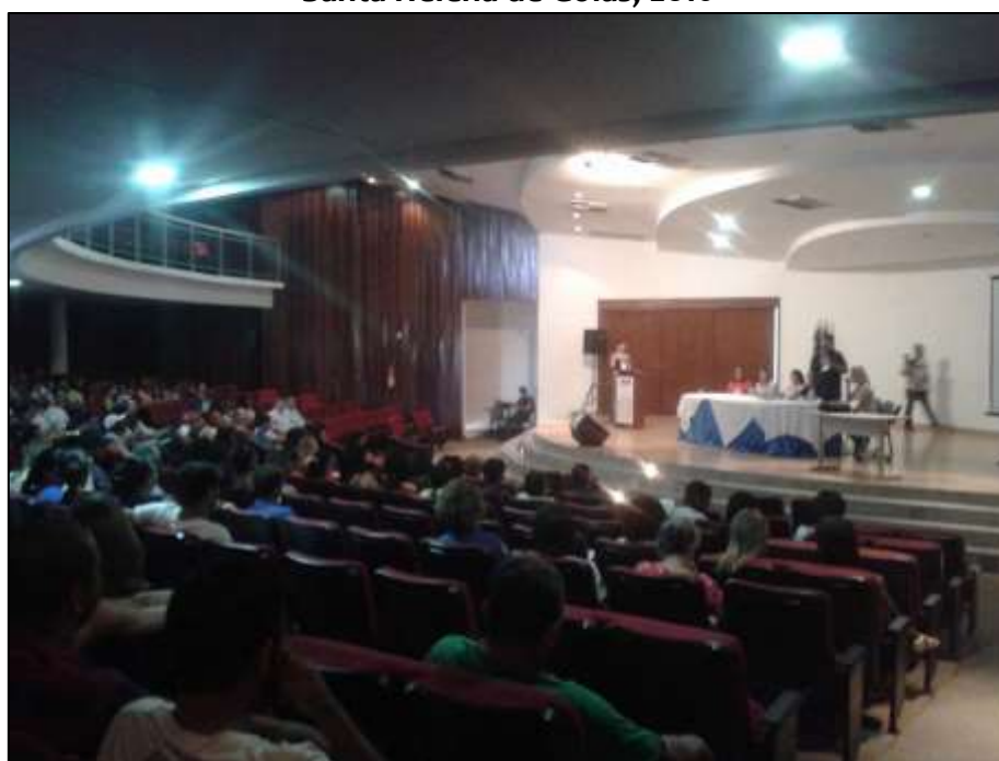
Figura 5. Abertura da I Conferência Territorial da Mulher do Sudoeste Goiano em Santa Helena de Goiás, 2016