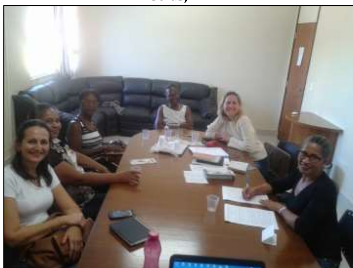
Figura 4. Reunião do Comitê Temática das Mulheres no Município de Paraúna – Goiás, 2016