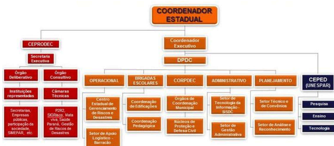
Figura 1 - Sistema Estadual de Proteção e Defesa Civil

As ações da Proteção e Defesa Civil do Paraná, visam prevenir ou minimizar os impactos negativos resultantes de eventos extremos, sejam estes naturais ou tecnológicos. Não obstante, tem como deveres atender as populações que foram atingidas por desastres e socorrer aquelas que ainda estão passando por estes eventos, a fim de evitar perdas materiais e humanas. Estas ações são possíveis com a participação de toda a comunidade na adoção de medidas preventivas, de preparação das pessoas, resposta eficiente e rápida recuperação local (Defesa Civil PR, 2018).