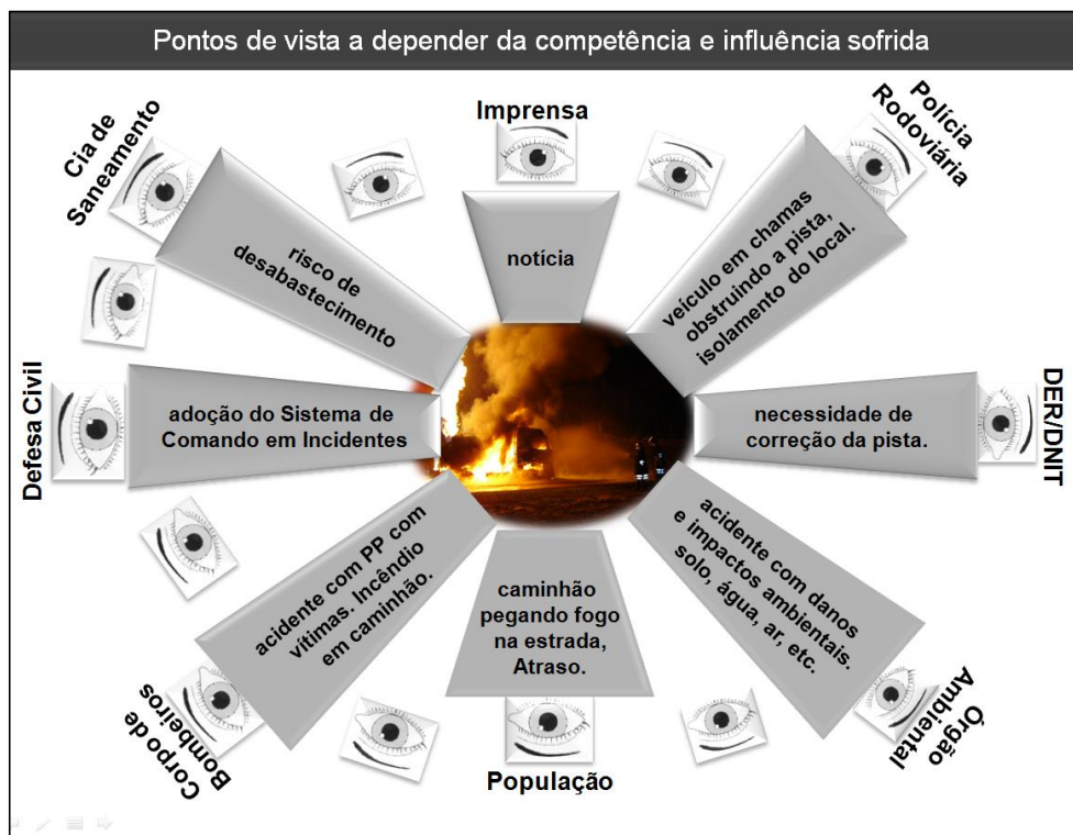
Figura 2 - Variações de ponto de vista sobre uma mesma emergência ambiental

O que se compreende é que existe uma previsão para que os órgãos se integrem no momento da resposta (Figura 2), no entanto essa integração restringe-se ao aspecto escrito e resulta na desconexão prática entre os órgãos, ocasionando intensificação e agravamento dos danos e prejuízos.