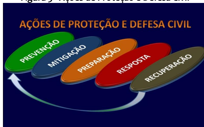
Figura 3 - Ações de Proteção e Defesa Civil

Também, chama a atenção a sigla P2R2, oficializada pelo Decreto nº 5.098/2004, comumente confundida com a antiga forma de abreviar as ações globais de defesa civil (prevenção, preparação, resposta e reconstrução), posteriormente recebendo a adição da mitigação, passando a compreender cinco ações (Figura 3), elaborada a partir da Lei Federal nº 12.608/2012.