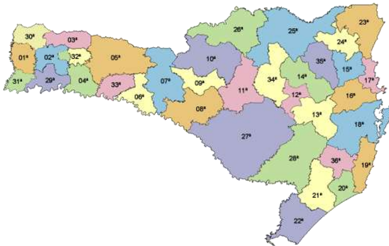
Mapa 1. Mapa do Estado de Santa Catarina – SDRs das 36 regiões

Da metade da década de 1990 até 2002, existiam, nas regiões do estado de Santa Catarina, os Fóruns Regionais de Desenvolvimento, articulados pelas Associações de Municípios e que desempenhavam a função de fóruns de discussão e articulação de estratégias de desenvolvimento regional, podendo ser considerados estruturas embrionárias de descentralização da gestão pública, com participação de representações do Estado, municípios, instituições regionais e representações sociais e corporativas 2 .