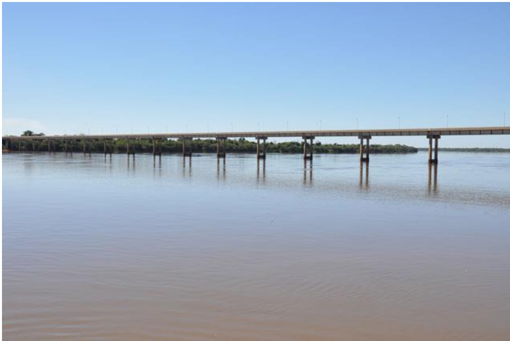
Figura 3: Ponte da Integração São Borja–Santo Tomé.

ocorreu em virtude da falta de articulação política e deficiência na elaboração do projeto e do edital de licitação.