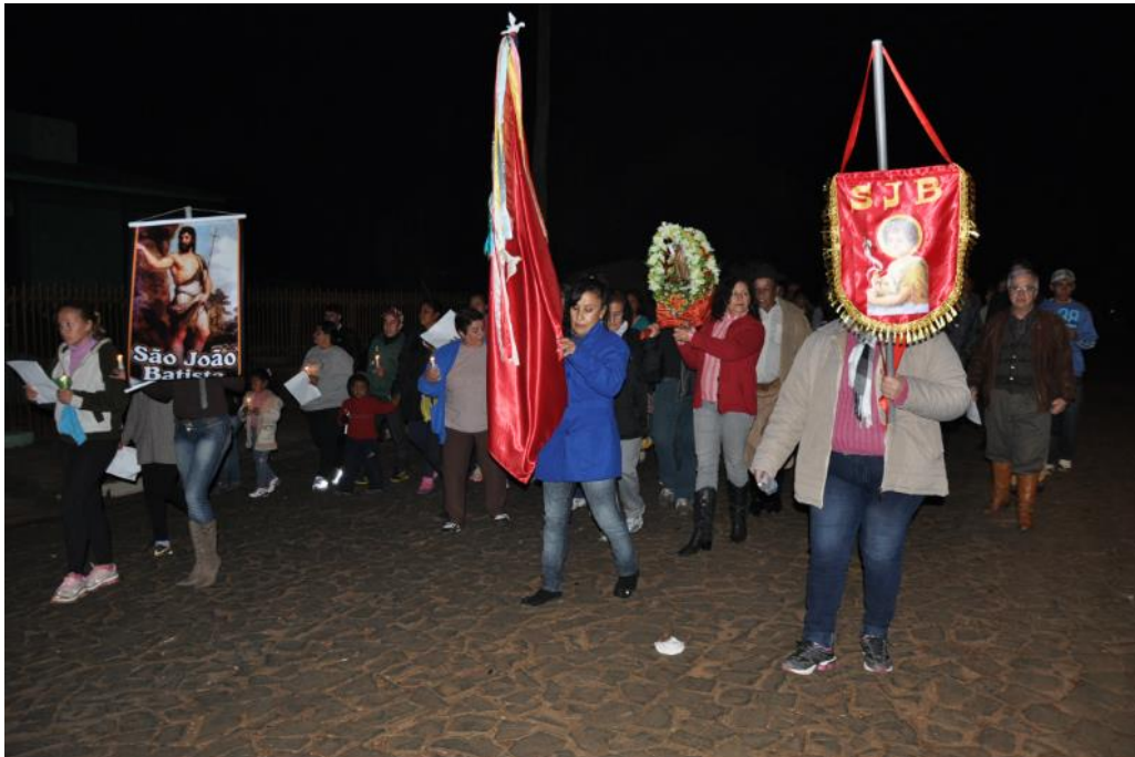
Figura 6: Procissão de São João Batista em São Borja.