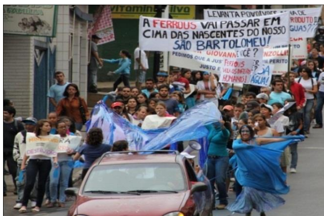
Figura 2. Passeata contra o Mineroduto da Ferrous e em defesa das Águas, Viçosa, 2012

chamaram a atenção da comunidade Viçosense sobre o abastecimento de água no município e a implantação do mineroduto.