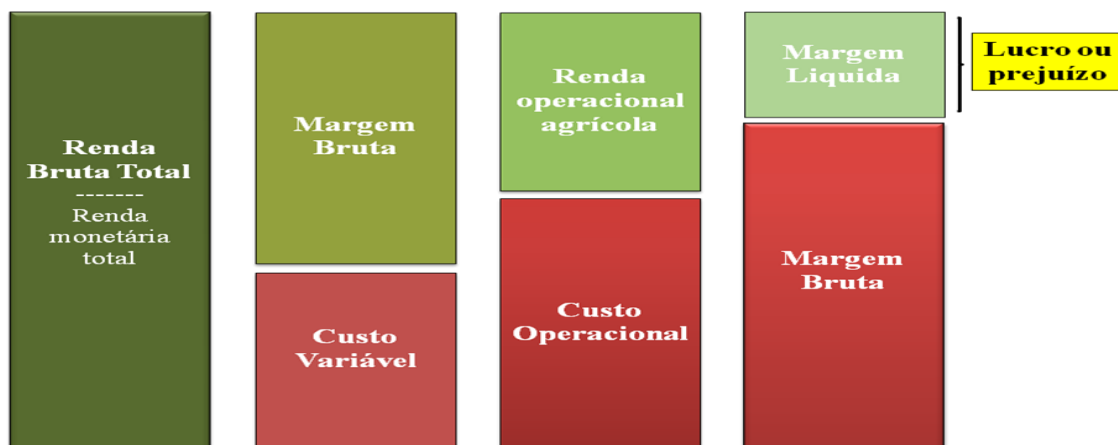
Figura 1 – Medidas de desempenho no gerenciamento agrícola

Na sequência, a Figura 1 ilustra a composição das medidas de desempenho, ressaltando quais custos são necessários, em diferença à receita total, para obter cada indicador econômico.