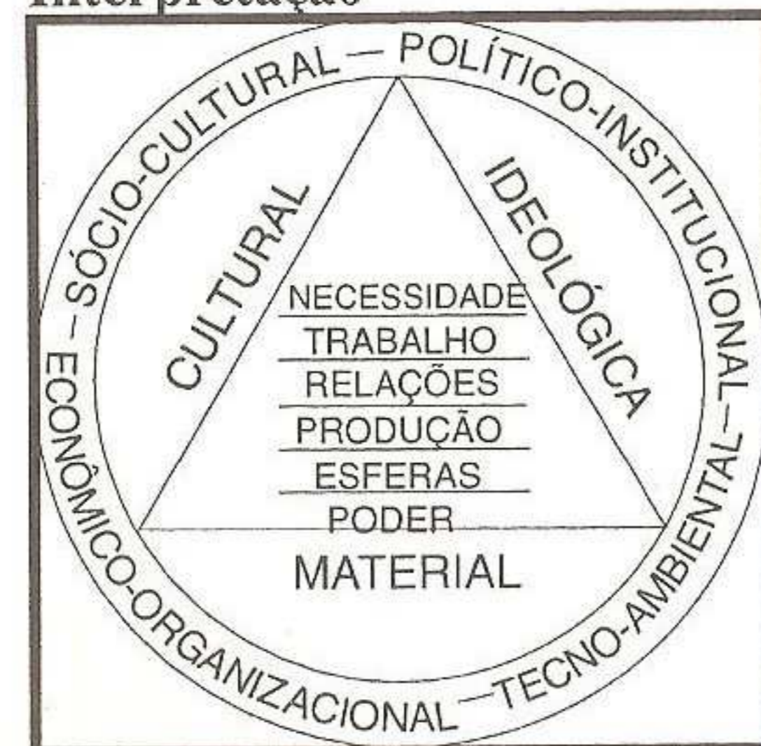
QUADRO 09 - Síntese da Interpretação

“pela participação social no processo de decisão e construção regional, garantindo a adaptação rápida às constantes mudanças provenientes do dinamismo global (...). Essa participação é, entretanto, um processo formativo lento, uma recuperação coletiva da capacidade de organizar e construir uma região [lugar, local, comunidade] que implica não cortar opções ou, melhor, não levar os diversos segmentos da sociedade a situações indesejadas (...) por absoluta falta de opções” (Leite, 1994, p.26).