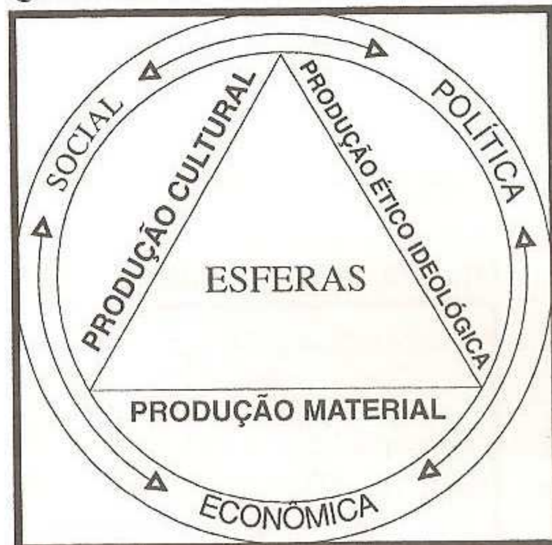
QUADRO 04 - Esferas