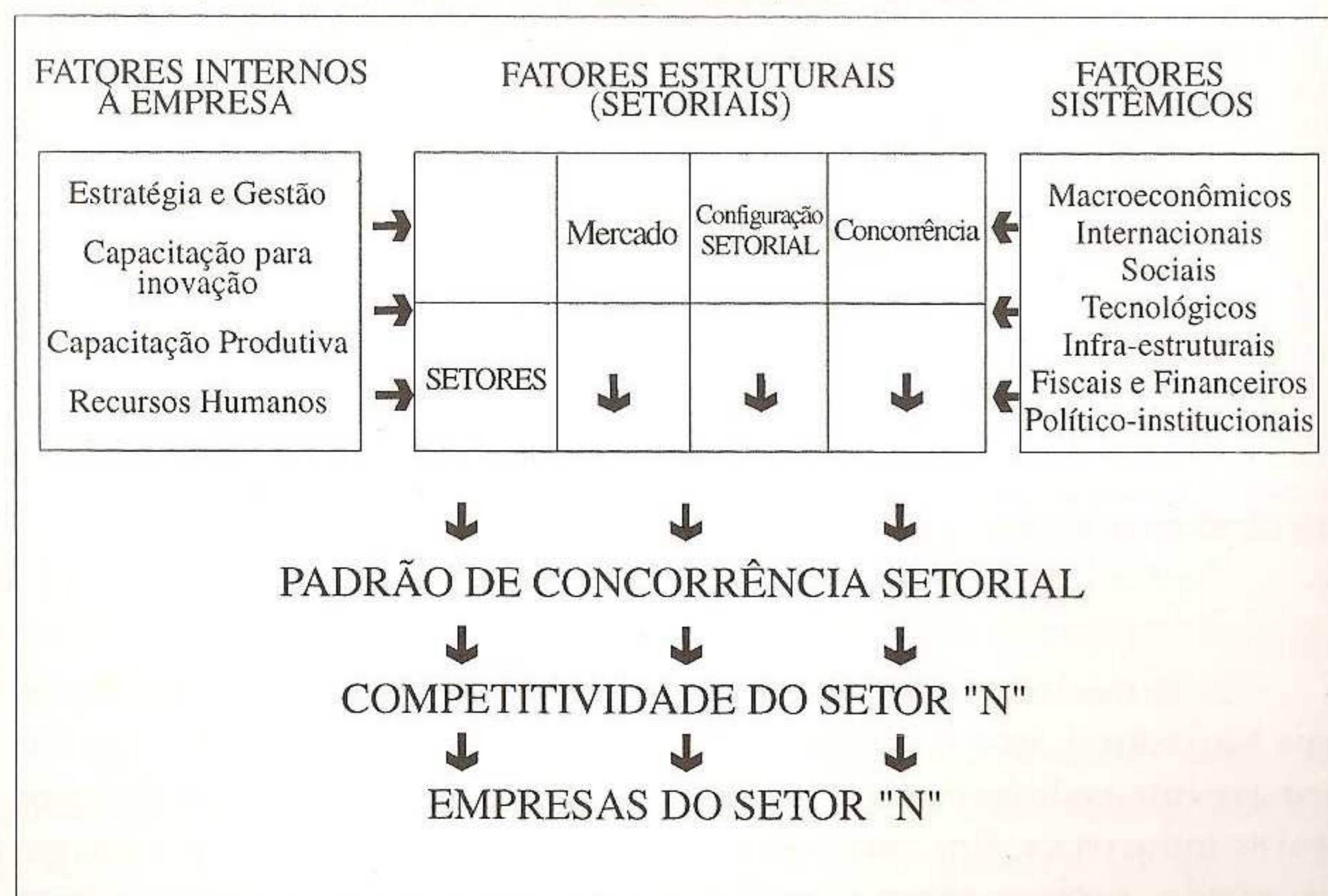
FIGURA 2 - Fatores determinantes da competitividade.

FONTE: Coutinho e Ferraz, 1994. p. 19, modificado pelo autor deste texto.