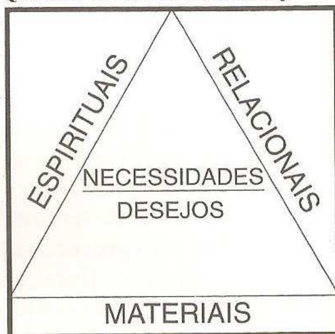
QUADRO 01 - Necessidades e Desejos

as necessidades básicas como as necessidades físicas de comer, beber, abrigar, etc. As espirituais englobariam todas as necessidades pessoais dos indivíduos e que tenham a ver com a intelectualidade. As necessidades relacionais seriam as decorrentes da estrutura e organização da sociedade.