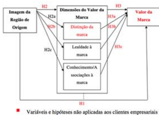
Figura 3. Modelo Conceptual da Influência da Imagem de Região de Origem no Valor da Marca Centrada no Cliente

Tendo por base o modelo conceptual apresentado, foram criadas nove hipóteses para os clientes individuais da Marca Açores e duas hipóteses para os clientes empresarias da Marca Açores. A variável “lealdade à marca” e a variável “valor da marca” (e conseqüentemente as suas hipóteses), não serão tidas em conta aquando da aplicação do modelo conceptual para a população clientes empresarias, uma vez que estas variáveis já estão inerentes às empresas aderentes ao selo (clientes empresariais).