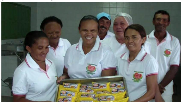
Figura 1. Agricultoras e Agricultores exibindo as polpas de fruta produzidas