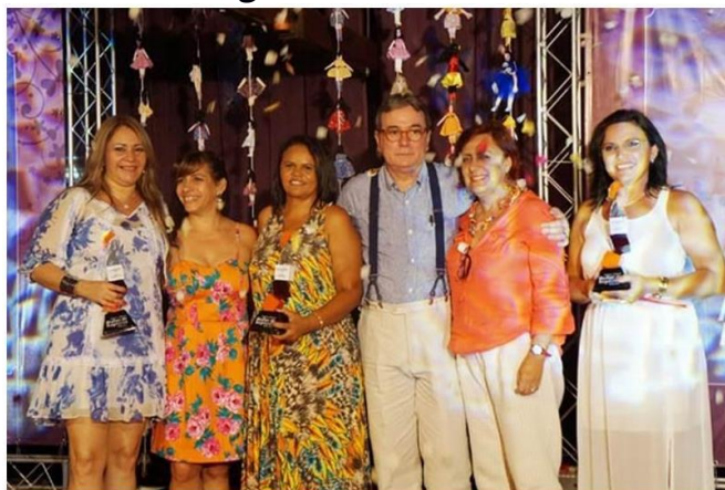
Figura 2. Troféu de 1º Lugar no Prêmio Sebrae Mulher de Negócio

Através de relatos dos associados fica claro que, a criação e a continuidade do trabalho realizado junto a Agroindústria Fonte de Sabor resultaram na melhoria da qualidade de vida dos associados gerando inclusão social, através da geração de renda, além do fortalecimento do associativismo, valorização da mulher e do jovem rural. E, ainda faz parte da concretização dos trabalhos realizados, o agradecimento com os prêmios SEBRAE Mulher de Negócios na categoria Negócios Coletivos (Associação e Cooperativa) nas edições 2010, com 3º lugar, 2011 com 2º lugar e, 2012 com o 1º lugar no Estado (ver Figura 2).