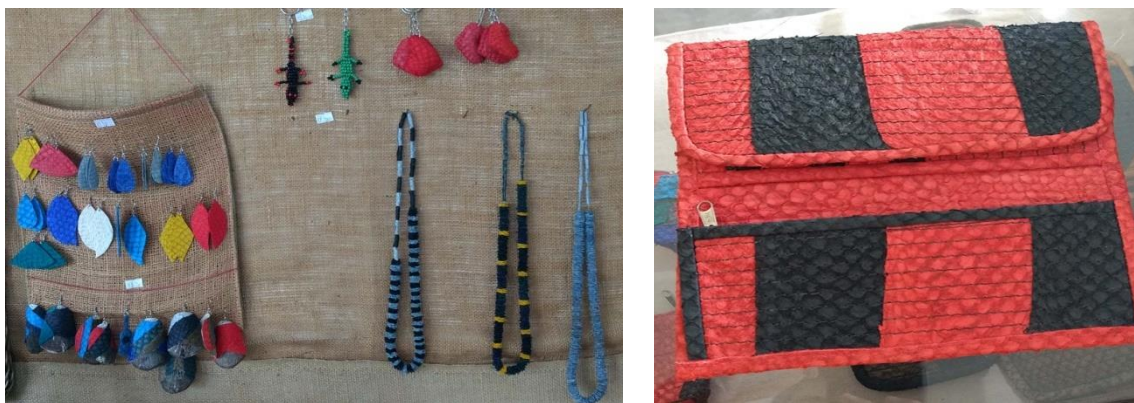
Figura 1 – Itens produzidos e comercializados pelo EES em análise

O EES escrutinado neste artigo foi fundado e registrado em 2003, na esteira das políticas públicas de fomento aos empreendimentos solidários; políticas estas que na época foram importantes, mas que contemporaneamente não mais se encontram em execução. Atualmente, o EES é composto por 13 mulheres, todas com alguma relação com a temática da pesca, que possui uma dimensão cultural e simbólica para os habitantes de Corumbá – as mulheres com as quais dialogamos são, elas próprias, pescadoras, além de esposas e/ou filhas de pescadoras/es. A atividade central do EES é a produção e comercialização de produtos artesanais feitos a partir do couro de peixe (normalmente de Tilápia), dos quais se destacam: colares, brincos, chaveiros, bolsas, cintos, chinelos e até vestimentas, todos com cores muito vibrantes e com uma estética ligada à temática do peixe, do pantanal, além das menções à cultura ribeirinha, negra e até indígena, conforme é possível ver na figura 1.