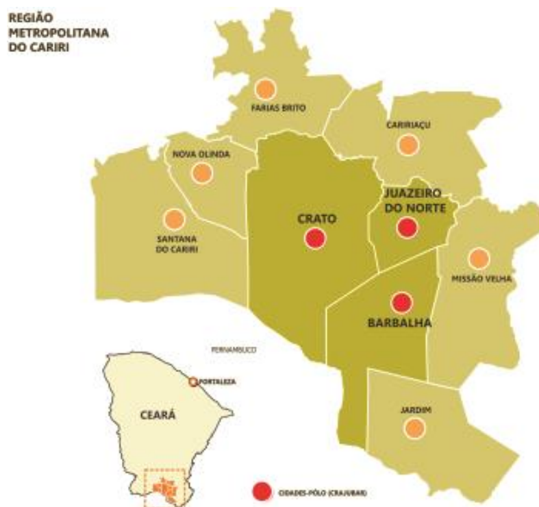
Figura 1 – Mapa de localização da Região Metropolitana do Cariri