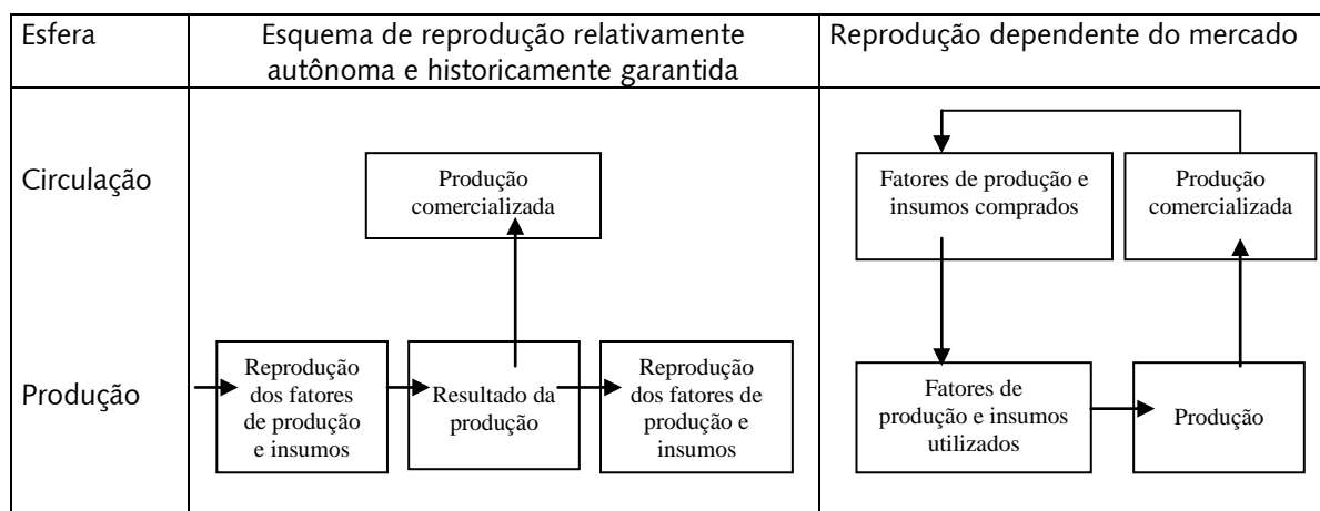
Figura 01. Reprodução autônoma (agricultura camponesa) x reprodução dependente do mercado (agricultura familiar) nas esferas da produção e circulação.

O resultado deste processo é uma divisão crescente do trabalho entre indústria e agricultura, assim como, entre diferentes unidades produtivas no interior do sistema agrícola. Porém, em contraste com a indústria, onde uma parte considerável da especialização crescente e da divisão do trabalho têm lugar no interior da fábrica (e portanto não implica um aumento importante na troca mercantil), o desenvolvimento agrícola implica um processo de externalização que gera uma multiplicação das relações mercantis. As tarefas que foram organizadas e coordenadas inicialmente, sob o mando do próprio agricultor, hão de ser coordenadas agora mediante o intercâmbio mercantil e por meio do sistema recém estabelecido das relações técnico-administrativas . Esta externalização crescente, não somente afeta as atividades de produção, mas resulta também numa transformação completa do processo de reprodução (Ploeg, 1992, p. 169-70). Tradução livre. Grifos nossos.