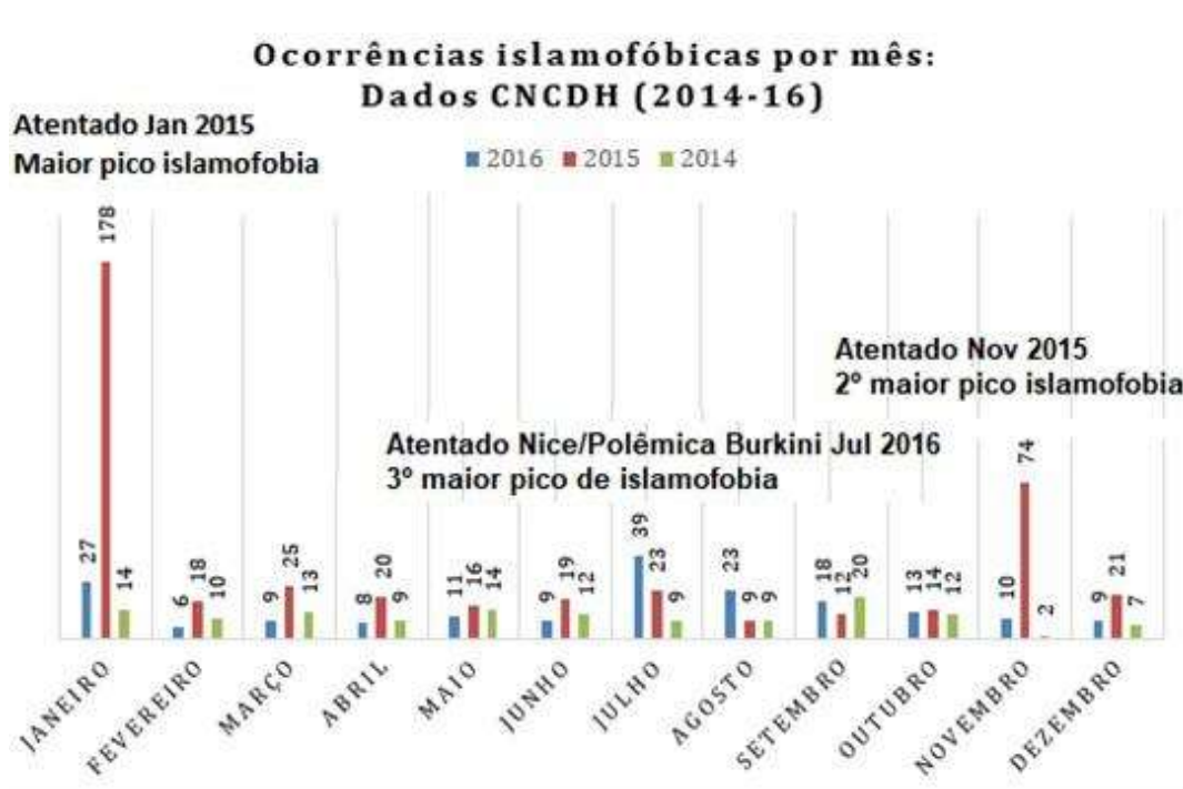
Gráfico 3: Ocorrências islamofóbicas mensais entre 2014-16 na França

Somam-se as polêmicas a respeito do burkini surgidas também em julho de 2016. Segundo Louati (2017), a histeria em relação a vestimenta normalizou a retórica racista contra os muçulmanos, fazendo da política identitária central na campanha presidencial de 2017. Visões estereotipadas e preconceituosas diante os islâmicos foram comuns a grande maioria dos presidenciáveis (LOUATI, 2017). Dado que o ano de 2015 testemunhou os maiores picos de islamofobia em toda a série histórica, é pertinente investigá-lo em detalhe, comparando-o com os anos anterior e posterior. O gráfico abaixo traz os registros mensais de islamofobia entre 2014-16, de modo a evidenciar a conexão entre os picos de islamofobia e a existência de ataques terroristas: