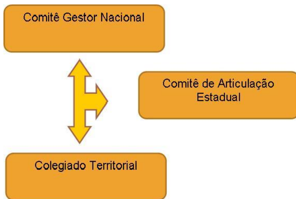
Figura 1. Gestão do Programa Territórios da Cidadania