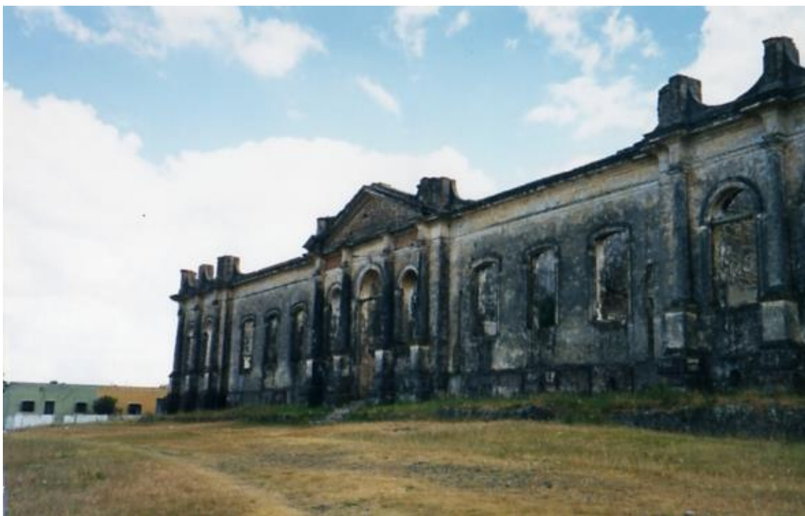
Figura 3: Ruínas da Enfermaria Militar.

Fonte: IPHAE. Processo de Tombamento: 47.068-19.00-SEC/86.