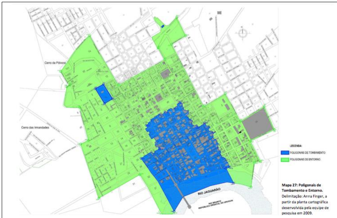
Figura 2: Mapeamento da área do tombamento (azul) e entorno (verde).