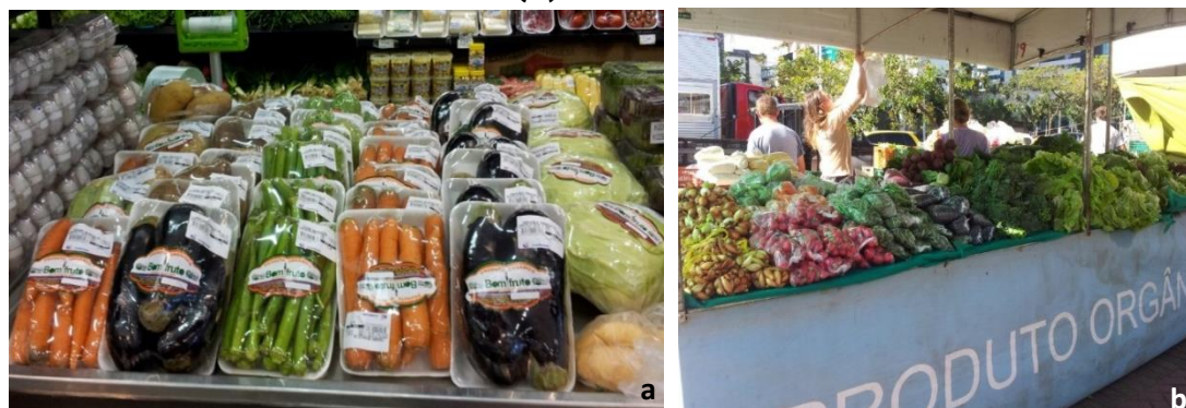
Figura 1. Comercialização de produtos orgânicos em supermercado (a) e feira-livre (b) de Vitória