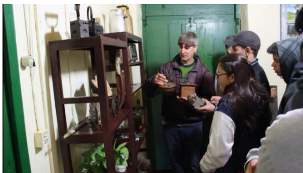
Fig. 1.

A partir da fala do agricultor entrevistado e da curiosidade dos alunos foi possível mostrar que a história pessoal e a afetividade de quem viveu e conviveu com lugares/objetos muda a maneira como se conta e enriquece o relato, trazendo à tona a saudade, o olhar delicado e sentimental sobre o físico, transcendendo apenas o usual, construindo memórias (DIÁRIO DE CAMPO, 10/09/2016).