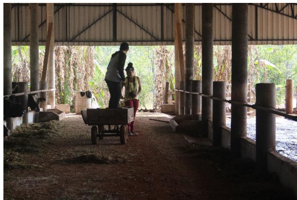
Fig. 2. Fonte: Dos autores.

Segundo Paulo Freire (2015a), ensinar exige respeito à autonomia e à singularidade do educando. Tendo em vista tal proposição, não se “forçou” o aluno a filmar, deixando ele a “seu tempo” para essa apropriação, o que demonstrou-se profícuo, pois, pouco a pouco, todos fotografaram, filmaram (Fig. 3), brincaram e entrevistaram, participando assim das diferentes etapas e funções da construção do vídeo. Podemos inferir que as singularidades apareceram, embora tenha prevalecido a importância do grupo.