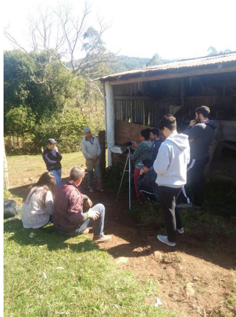
Fig. 4.

A comunicação didática do conhecimento é meio, instrumento e código, através dos quais os alunos tem a possibilidade de reconstruir e reelaborar o saber (RANGEL; FREIRE, 2010). Foi dessa forma que a produção audiovisual possibilitou uma comunicação didática de alunos para com outros alunos, com professores e com a comunidade.