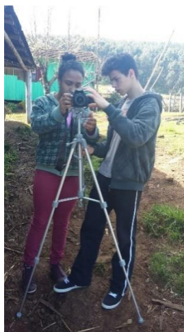
Fig. 3.

Segundo Paulo Freire (2015a), ensinar exige respeito à autonomia e à singularidade do educando. Tendo em vista tal proposição, não se “forçou” o aluno a filmar, deixando ele a “seu tempo” para essa apropriação, o que demonstrou-se profícuo, pois, pouco a pouco, todos fotografaram, filmaram (Fig. 3), brincaram e entrevistaram, participando assim das diferentes etapas e funções da construção do vídeo. Podemos inferir que as singularidades apareceram, embora tenha prevalecido a importância do grupo.