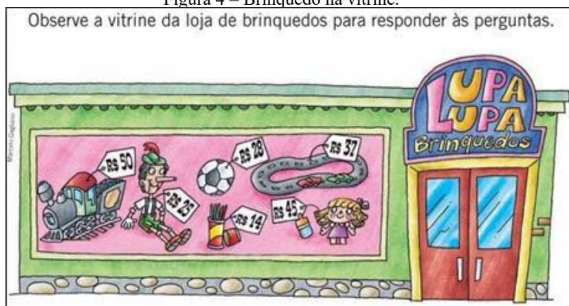
Figura 4 – Brinquedo na vitrine.

Sujeitos que brincam no currículo de matemática marcado pela dimensão de gênero no binário discursivo das representações dos livros didáticos atuam na construção de uma identidade aprisionada na criança-brinquedo, cria a ilusão hegeliana de expressar a vida em categorias reais. Meninos compram carrinhos e meninas compram bonecas são discursividades expressas na atividade da figura 4: “Juliana quer comprar a boneca” e “Ramon comprou a bola de futebol e pagou com 3 notas de 10 reais”, são frases contidas nessa atividade, cujo objetivo é ensinar às crianças como realizar operações básicas com unidades monetárias.