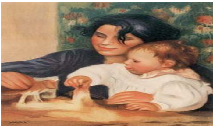
Fig. 2 - Renoir.

No segundo encontro utilizou-se a obra de arte Gabrielle e Jean , de Pierre-Auguste Renoir, de 1895, óleo sobre tela, 41 x 32,5 cm. Nesta obra foi proposto ao grupo a problematização da especificidade do trabalho docente.