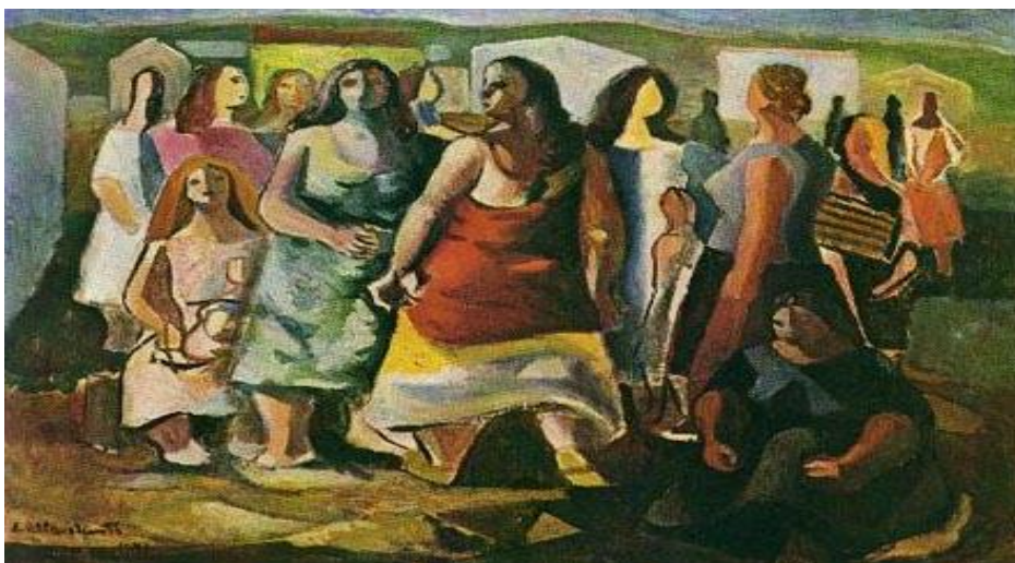
Fig. 4 - Di Cavalcanti.

No quarto encontro usou-se a obra de arte Mulheres Protestando , de Di Cavalcanti, de 1941, óleo sobre tela, 51 x 70 cm. Nesta obra se propôs que o grupo alcançasse a problematização acerca do sentido da organização política da categoria de trabalhadores da educação.