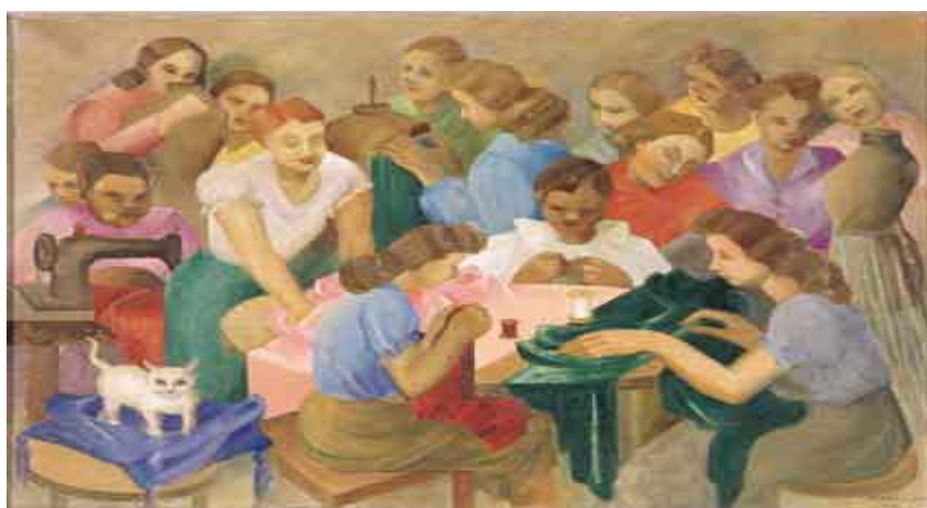
Fig. 1 - Tarsila do Amaral.

O primeiro encontro do grupo de reflexão partiu da apresentação da obra Costureiras , de Tarsila do Amaral, de 1950, óleo sobre tela, 73,3 x 100, 2 cm. O objetivo foi desencadear a fala problematizadora sobre a questão do trabalho e trabalho docente.