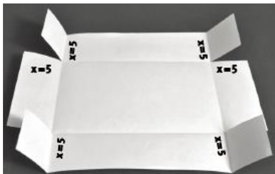
Fig. 1 - Exemplo de possibilidade de construção da caixa solicitada.