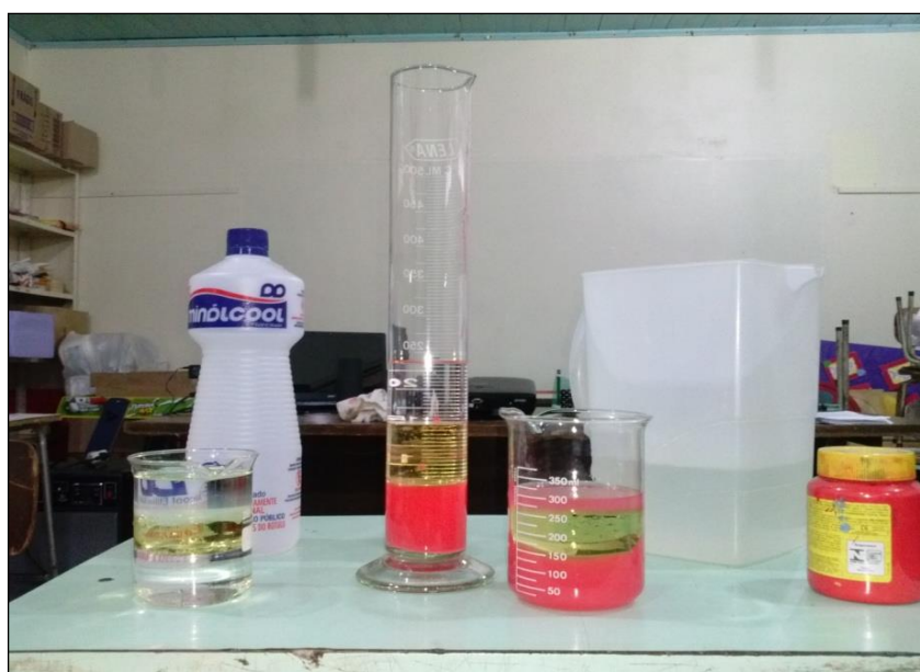
Fig. 2 - Ilustração do experimento realizado pelos envolvidos na tarefa de Modelagem.