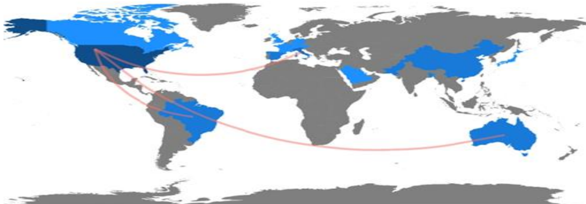
Figura 2 - Distribuição geográfica das produções científicas por país

A Tabela 2 fornece informações sobre as características dos estudos incluídos, como o país onde a pesquisa foi realizada, o tamanho da amostra participante e os instrumentos escolhidos pelos autores para avaliar os níveis de atividade física dos estudantes universitários. Essas informações são relevantes para compreender a diversidade dos estudos e as abordagens utilizadas na mensuração da atividade física nessa população.