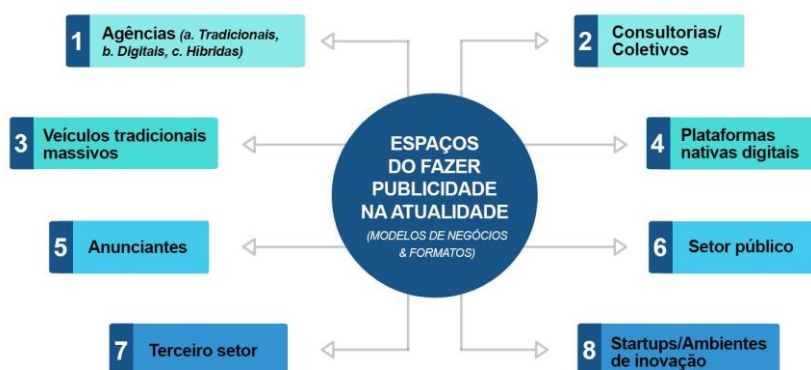
Figura 1 – levantamento dos espaços do fazer publicidade na atualidade