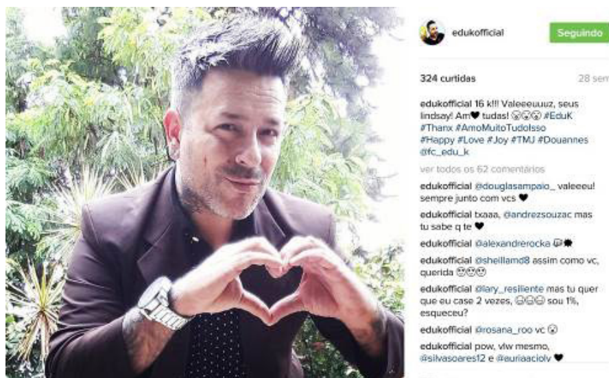
Figura 4: Post de agradecimento do artista ao atingir 16 mil seguidores