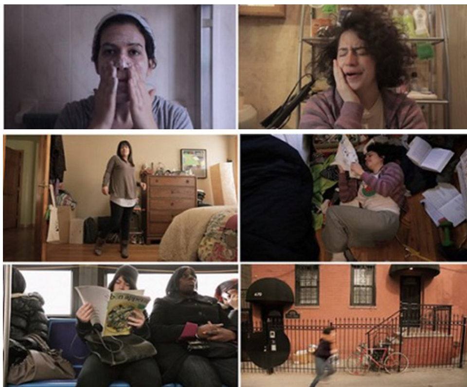
Figura 2 Cenas dos vídeos no Youtube, com destaque de cenas do websódio The Commute