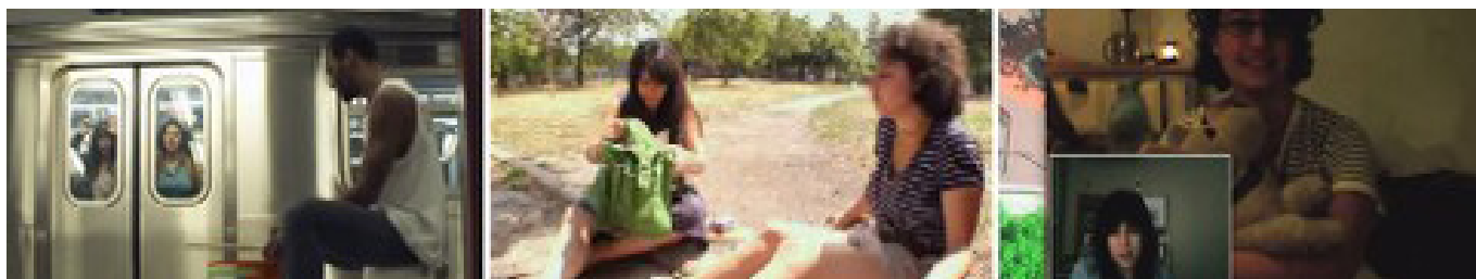
Figura 1 - Cenas dos vídeos no Youtube, com destaque às locações na cidade de Nova York, fotografia menos estável e utilização da webcamonte: Printscreen produzido pelas autoras

Zanetti (2013) discorre sobre essa estética intimista e simples das narrativas seriadas em ambientes virtuais, circunscrita no contexto das produções independentes, com poucos recursos financeiros, que efetiva gêneros conhecidos como confessionais na WEB (SIBILIA, 2008), entre eles “os vlogs , fotologs , vídeos caseiros - caracterizados por uma estética amadora e basicamente associado à figura do internauta como personagem de si mesmo” (ZANETTI, 2013, p. 79). Ainda existem webséries com essa concepção. No entanto, o cenário vem mudando. Aeraphe (2013), professor e realizador na área, afirma que na internet observa-se uma quantidade diversificada de conteúdo, das celebridades instantâneas, passando pelas produções de qualidade duvidosa ao conteúdo premium - capaz de prender a atenção do público e consolidar modelos de negócios mais estáveis.