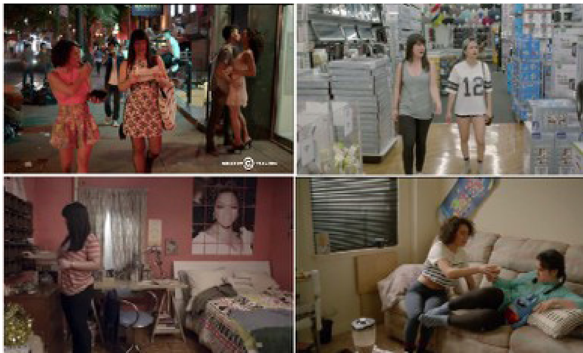
Figura 4 - Cenas dos episódios da sitcom, com destaque para locações externas nas ruas de Nova York, na loja Bed, Bath & Beyond e os interiores das casas de Abbi e Ilana