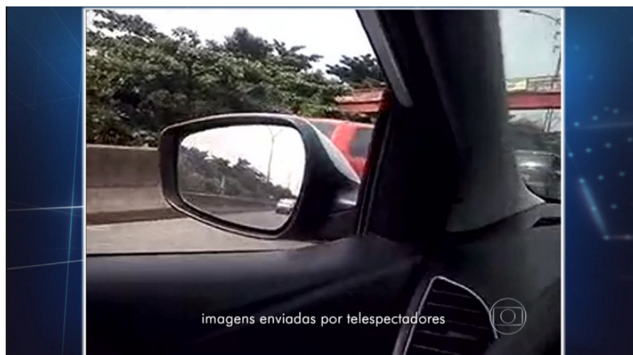
Figura 2: Frame do vídeo - Jornal Nacional (10/11/2015).