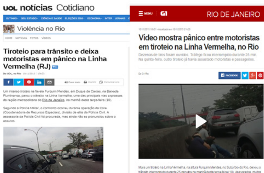
Figura 4: Exemplos de circulação referente ao vídeo de instituição midiática

O flagrante do tiroteio pode ser encontrado na íntegra, editado, fundido com outros vídeos, acompanhado ou não de texto jornalístico (Figura 4).