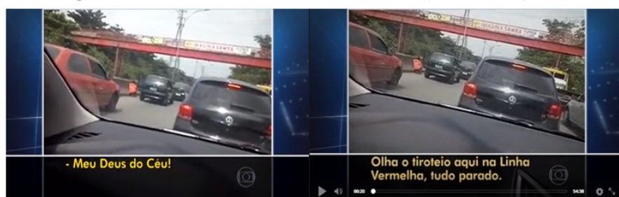
Figura 1: Frame do vídeo - Jornal Nacional (10/11/2015).