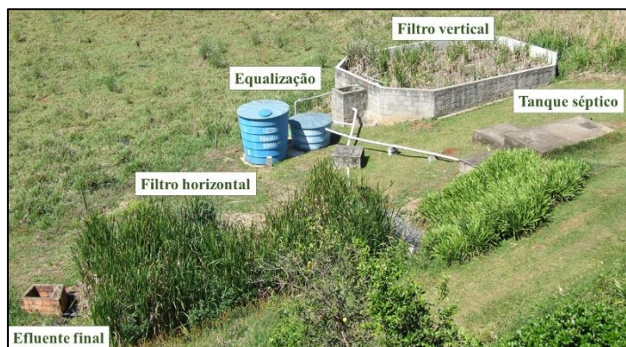
Figura 1 – Estação de tratamento de efluentes do CETREVI.

Na Figura 1, pode-se visualizar a disposição física da ETE, a qual é composta por um tanque séptico (TS), um reservatório de equalização (EQ), um wetland construído de fluxo vertical (WV), plantado com as espécies Taboa ( Typha spp.) e Junco ( Juncos spp.), e um wetland construído de fluxo horizontal (WH). O efluente final é infiltrado no solo.