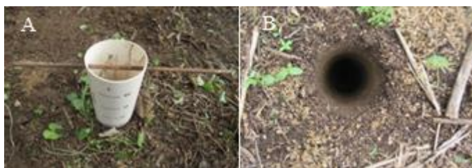
Figura 2 – Coletor cravado no leito (a) e leito após a retirada do coletor (b).

A caracterização do grau de colmatação no sistema foi realizada através de coletas no leito do wetland [10-11]. As amostras do leito foram coletadas a uma profundidade entre 0 e 20 cm e entre 20 e 35 cm, conforme a Figura 2.