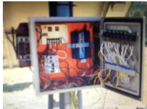
Figura 3 - Sistema de comando.