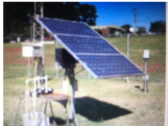
Figura 2 - Sistema fotovoltaico de 300 Wp.

forma ( FF (G_i) ) para cada condição particular de operação. Esses cálculos foram realizados conforme Lorenzo (1994), que considerou em sua metodologia os valores medidos da irradiância no plano dos módulos ( G_i ) e a temperatura na célula fotovoltaica ( T_c ) para obter o Fator de Forma ( FF ) de uma célula fotovoltaica.