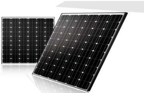
Figura 1 - Foto do módulo solar.