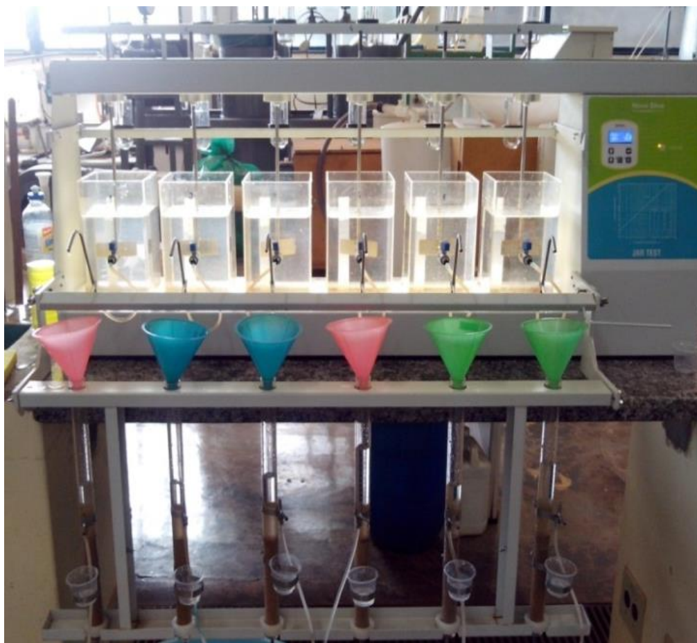
Figura 1: Jar-test acoplado aos filtros de laboratório