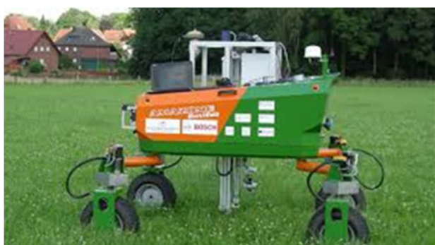
Figura 5 – BoniRob [19].

definitiva, arrancando-o pela estrutura. Ele possui o tamanho de um carro popular e pesa quase meia tonelada, contudo é ágil, sendo capaz de eliminar quase duas plantas daninhas por segundo.