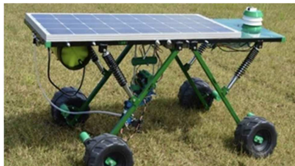
Figura 6 – Dispositivo robótico, G bot.

Outra empresa, com sede na Argentina, desenvolveu um robô (Figura 6) equipado com sensores que fazem a identificação do solo e das culturas, coletando dados a campo, como: umidade e compactação do solo, pressão atmosférica, ph, salinidade temperatura. A partir dessas informações, são gerados mapas com aplicação na agricultura de precisão, com o uso de raios laser e vapor de água. Além da eliminação das plantas daninhas, o robô embarca uma placa fotovoltaica, sendo movido por energia solar.