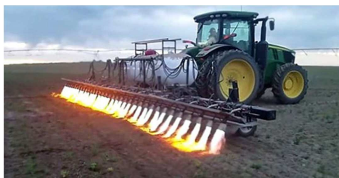
Figura 3 – Método a fogo.

combustível), alta periculosidade, possível dano ao sistema biológico do solo e risco de incêndios em locais com matéria seca.