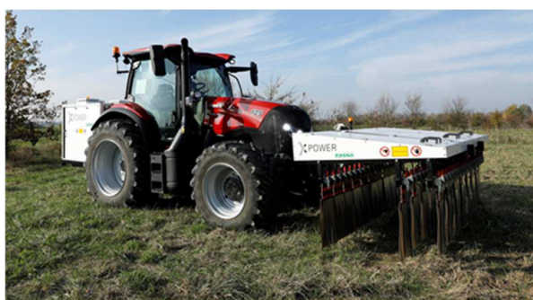
Figura 4 – Sistema elétrico de eliminação de plantas daninhas.

Atualmente, existem dois tipos principais de tratamento elétrico para controle de plantas daninhas. O primeiro é por descargas de faísca, sendo utilizados pulsos de alta tensão e curta duração para controle de plantas daninhas, desbaste da planta e aceleração do amadurecimento. O segundo é por contato contínuo, que usa um eletrodo conectado a uma fonte de alta tensão.