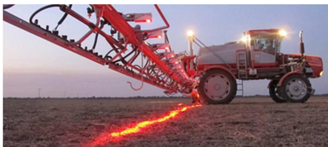
Figura 2 – Sistema WEEDIT.

Outra tendência compreende a elaboração de mapas georreferenciados a partir da coleta das informações in loco , gerando os mapas de tratamento ou aplicação. Depois, tais mapas são inseridos nos sistemas de controle do equipamento aplicador para comandar a distribuição localizada dos produtos.