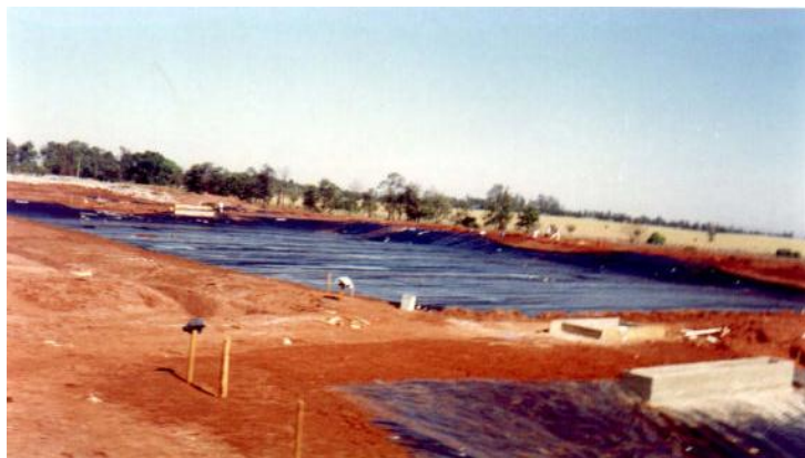
Figura 5 – Obras de implantação do aterro sanitário de Cianorte/PR, ano de 2000 [12].

Municipal n. 001/2002. Neste sentido a PMC e a SANEPAR obtiveram recursos financeiros e realizaram a implantação do aterro sanitário (Figura 5).