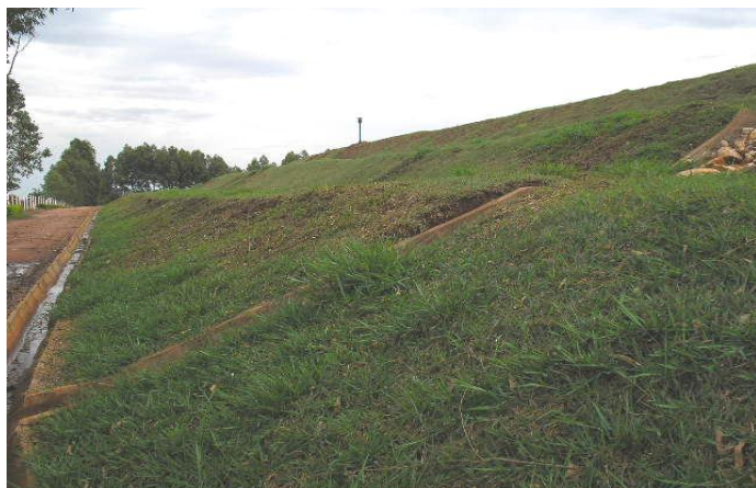
Figura 11 – Célula concluída no aterro sanitário de Cianorte, ano de 2008

A Figura 11 destaca a célula concluída e formada por três taludes.