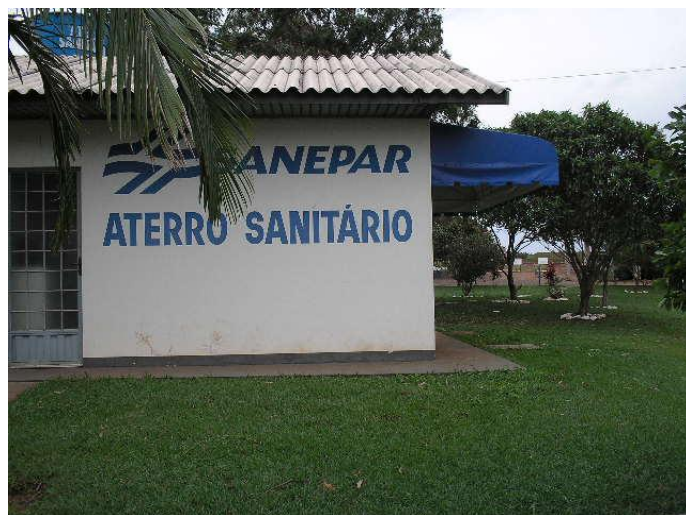
Figura 9 – Vista parcial da área administrativa do aterro sanitário de Cianorte/PR

Schinus terebinthifolius (Aroeira vermelha), Bauhinia forficata (Pata de vaca), Lithraea molleoides (Aroeira brava) e Erythrina speciosa (Mulungo). Essas espécies podem ser utilizadas na recuperação de áreas de lixões por terem se destacado em pelo menos um dos parâmetros avaliados: sobrevivência, altura ou diâmetro a altura do solo.