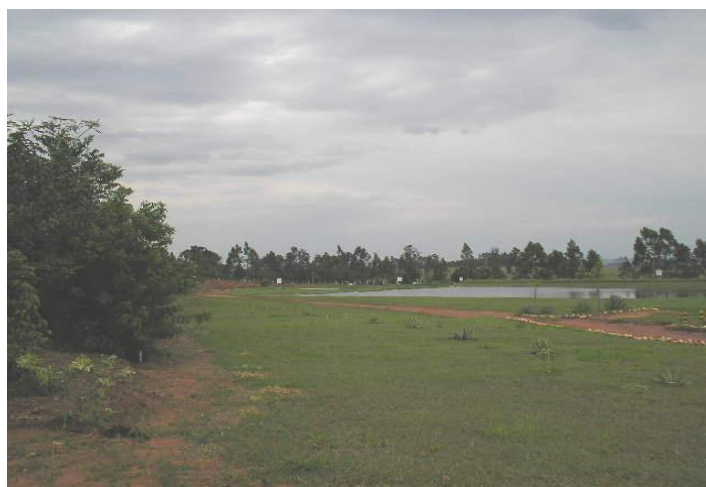
Figura 13 – Vista parcial das lagoas de tratamento do lixiviado do aterro sanitário de Cianorte/PR.

O sistema de tratamento do lixiviado ocorre em três lagoas (Figura 13): a lagoa anaeróbia, a lagoa facultativa e a lagoa de polimento. Todas as lagoas apresentam impermeabilização de fundo com manta de PVC de 1.0 mm. O tratamento ocorre através de atividades biológicas e devem estar dentro dos parâmetros legais exigidos pelo Instituto Ambiental do Paraná [13].