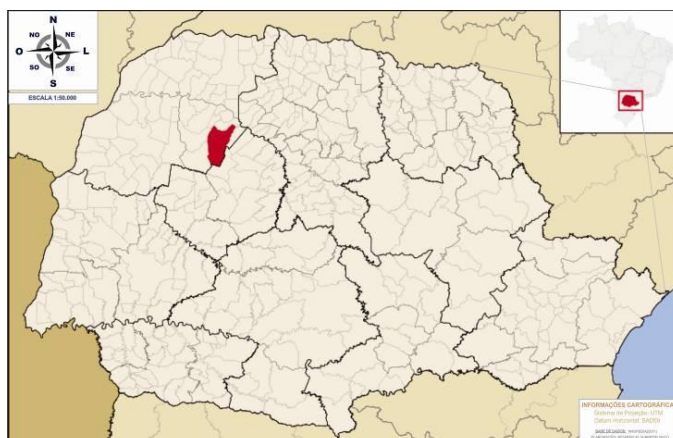
Figura 1 – Mapa de localização do município de Cianorte no estado do Paraná.

O Estado do Paraná possui população de 10.444.526 habitantes, destes em torno de 69.958 (0,67%) residem na cidade de Cianorte, que possui área territorial de 811.668 km 2 , densidade demográfica de 86,19 hab./ km 2 e grau de urbanização de 89%. (Tabela 1).