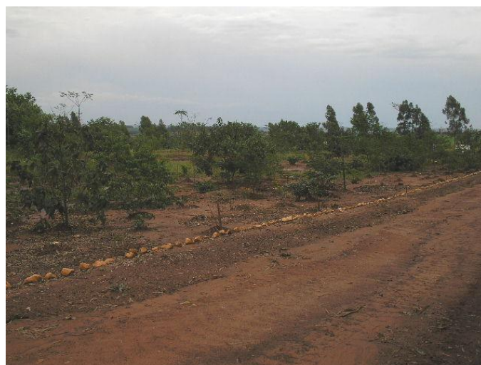
Figura 10 – Recuperação da área degradada do antigo lixão de Cianorte.