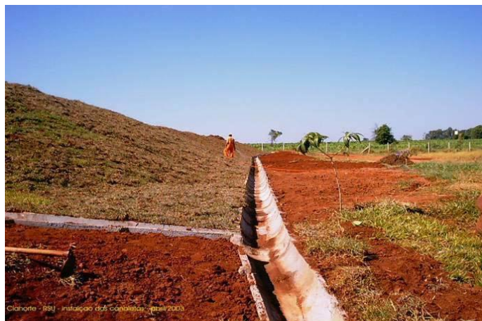
Figura 12 – Caneletas de concreto utilizado no sistema de drenagem de águas pluviais [15]

O sistema de drenagem de águas pluviais é realizado por meio de canaletas de concreto que fazem a captação apenas do escoamento das células do aterro, conforme Figura 12.