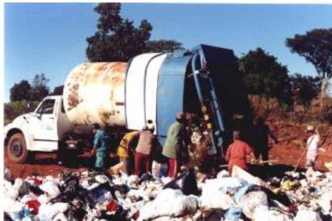
Figura 4 – Presença de catadores no lixão de Cianorte/PR, em 1999 [12].

Ocasionalmente ocasionando impactos sanitários, com a proliferação de vetores de doenças; ambientais, ocasionando a poluição e contaminação do solo e dos recursos hídricos superficiais e subterrâneas e sociais, com a presença de diversos catadores que ali buscavam seu sustento por meio da catação de materiais recicláveis (Figura 4).