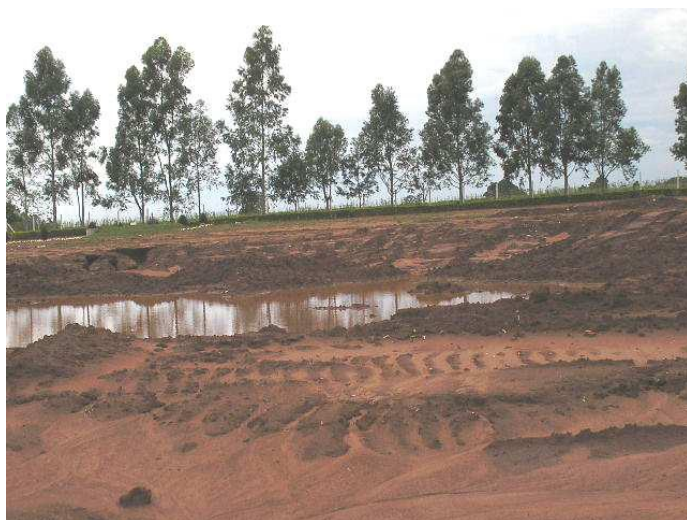
Figura 14 – Acúmulo de água no entorno do aterro sanitário de Cianorte/PR [13]

Observou-se também que em períodos chuvosos os maquinários não realizam a compactação dos materiais, pois os resíduos ficam encharcados de água. Estes maquinários possuem baixa potência do motor, que não permite seu deslocamento até as células de lixo, resultando na ausência de cobertura dos resíduos nestes períodos, deixando-os expostos permitindo a proliferação de moscas e mosquitos e presença de aves.