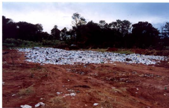
Figura 3 – Lixão municipal de Cianorte/PR, em 1999 [12].

A disposição final dos RSU do município de Cianorte, entre os anos de 1953 até meados de 1999, era feita a céu aberto em um lixão localizado na zona rural do município (Figura 3).