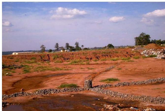
Figura 6 – Abertura da primeira célula do aterro sanitário de Cianorte/PR, ano de 2004 [15]

Em 2010, a PMC autorizou a o recebimento dos RSU provenientes de São Tomé e Terra boa, municípios vizinhos. Esta autorização foi regulamentada por meio da Lei Municipal nº 3.268/2009 e está condicionada a prestação dos serviços pela SANEPAR, por contrato de programa, autorizado por convênio de cooperação a ser firmado entre os citados municípios e o Estado do Paraná [16].