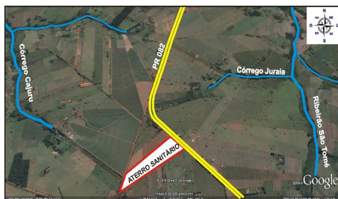
Figura 7 – Localização do aterro sanitário destacando recursos hídricos e vias de acesso

A destinação final dos resíduos sólidos urbanos em aterros sanitários regionais viabiliza o rateio dos custos operacionais e administrativos, a contratação de serviços profissionais de operação do aterro, a otimização do uso de máquinas e equipamentos, a redução do número de áreas utilizadas, a redução de possíveis focos de contaminação ambiental e, consequentemente, a concentração das ações de fiscalização do órgão ambiental competente [17]. Alguns autores desenvolveram metodologias para alcançar a avaliação quantitativa do sistema de consórcio intermunicipal, levando em consideração as análises de custos, o nível estratégico de localização de aterros e de roteirização e a programação de frota, com auxílio de um sistema de informações geográficas. Este método, aplicado em um consórcio intermunicipal existente, permitiu concluir que esta forma de gestão é melhor alternativa quando comparada a solução isolada [18].