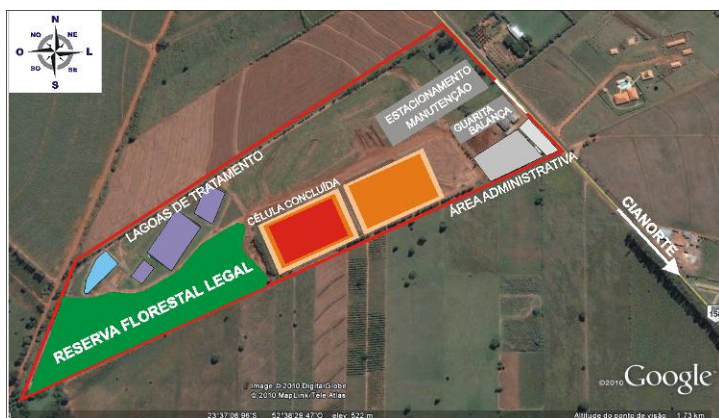
Figura 8 – Delimitação do zoneamento interno do Aterro Sanitário de Cianorte

O aterro está instalado em local permitido, licenciado pelo Instituto Ambiental do Paraná (IAP). A área é composta por Reserva Florestal Legal, lagoas de tratamento do lixiviado, lagoa de infiltração, célula concluída, célula utilizada para disposição de resíduos sólidos, área para manutenção da frota de veículos, estacionamentos, guarita, balança, área administrativa, refeitório e banheiros (Figura 8). Além disso, o local é cercado, possui vigilância e balança rodoviária digital eletrônica, com capacidade para 30 toneladas, com registro das pesagens, entradas e saídas dos caminhões coletores.