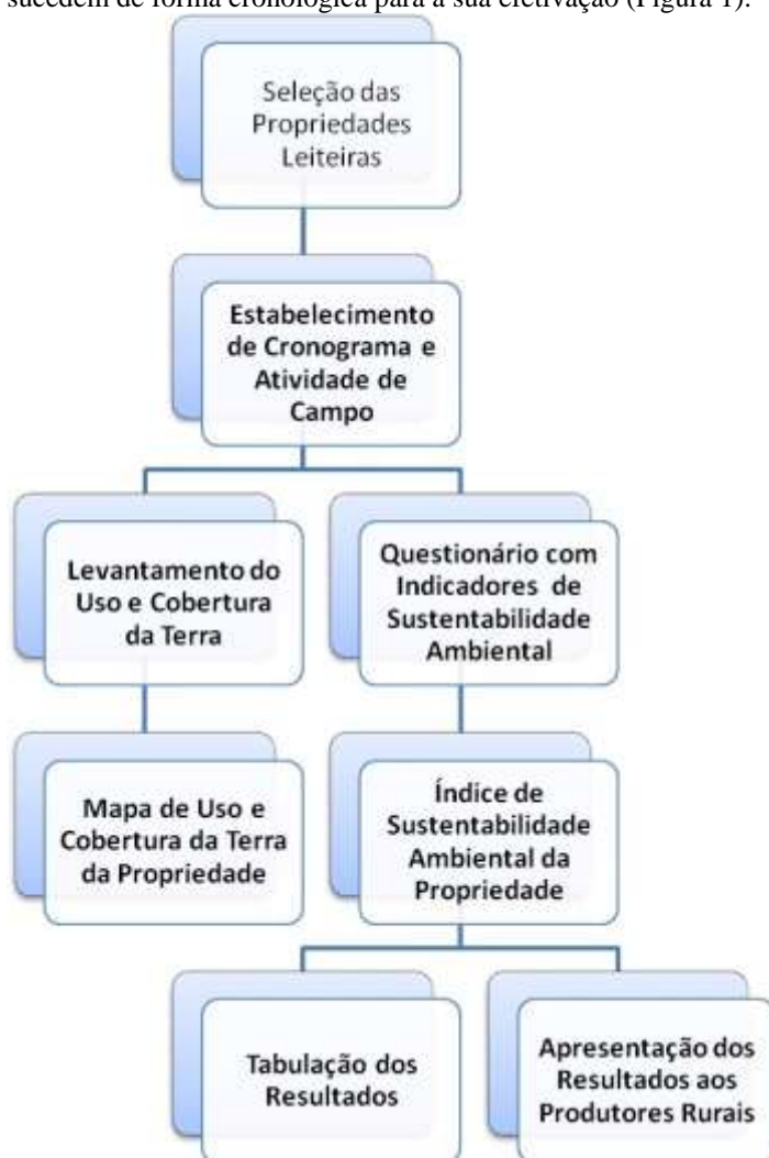
Figura 1 - Fluxograma das etapas metodológicas.

A partir da aplicação da avaliação de sustentabilidade ambiental nas propriedades participantes da pesquisa, foi possível verificar que são necessárias etapas interdependentes e que sucedem de forma cronológica para a sua efetivação (Figura 1).