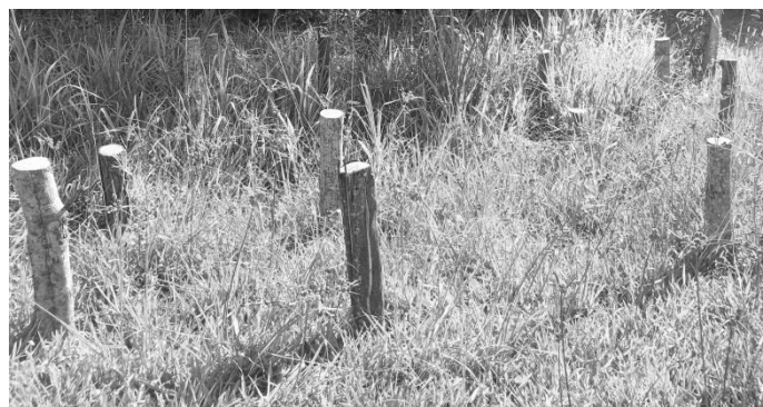
Figura 1- Campo de apodrecimento após a instalação dos moirões.

O experimento foi implantado no município de Frederico Westphalen- RS. Foram utilizadas 20 árvores, cinco para cada espécie, das quais foram confeccionados moirões roliços, com casca, retirados da parte superior das amostras, com dimensões de 1,30 m de comprimento e em média 12 cm de diâmetro. As peças foram levadas a campo, em área coberta predominantemente por gramíneas e enterradas verticalmente no solo a uma profundidade de 40 cm (Figura 1).