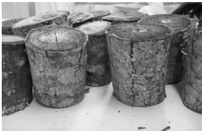
Figura 3 - Discos utilizados na determinação do teor de umidade das peças.

Através de idas a campo mensais, foram realizadas inspeções visuais para verificar o estado das peças e o desenvolvimento de organismos xilófagos.