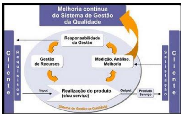
Figura 1: Melhoria contínua do Sistema de Gestão da Qualidade

Em alguns fóruns, a certificação ISO 9001 ainda é entendida como burocracia. Para outros, representa uma oportunidade de introduzir reformas para inserir as instituições no caminho da modernização administrativa, perseguindo-se maior eficácia e eficiência. A prática tem evidenciado distintas vantagens nos mais variados setores. Nesse contexto, o propósito da ISO 9001:2015 é proporcionar vantagem competitiva por meio da qualidade. Trata-se de um padrão internacional para a implementação de um sistema de gestão da qualidade calcado em oito princípios destinados a melhorar o desempenho organizacional, a saber: (1) enfoque no cliente; (2) liderança; (3) envolvimento das pessoas; (4) abordagem a processos; (5) abordagem sistêmica à gestão; (6) melhoria contínua; (7) abordagem efetiva à tomada de decisão; e (8) relação com os fornecedores mutuamente benéfica. A Figura 1 abaixo apresenta de forma esquemática a melhoria contínua viabilizada pelo sistema de gestão da qualidade.